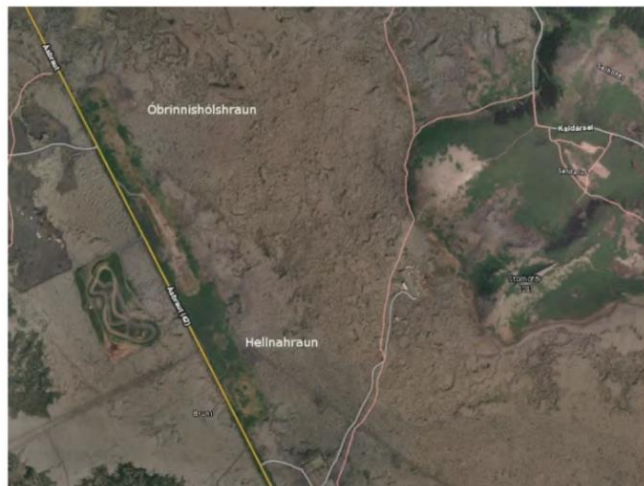
Mynd 1 - Mynd úr Umhverfisskýrslu 2014

„Úr hraunjaðar Óbrinnishólshrauns við Stórhöfða er skilgreind gönguleið. Frá Stórhöfða og í Suður, í átt að Krýsuvík er þekkt forn leið Stórhöfðastígur. Leiðin hefur í fornleifaskráningu verið metin hafa talsvert minja- og varðveislugildi. Fyrirhugað íþróttasvæði er ekki líklegt til að raska gönguleiðinni við hraunjaðarinn en breytt ásýnd hraunsins er líkleg til að hafa áhrif á upplifun þeirra sem ganga þar um. Stórhöfðaleið liggur inn á syðsta hluta íþróttasvæðisins og þar gæti upplifun göngufólks breyst auk þess sem lýsing á golfvellinum getur haft áhrif.“ (Umhverfisskýrsla, janúar 2014)