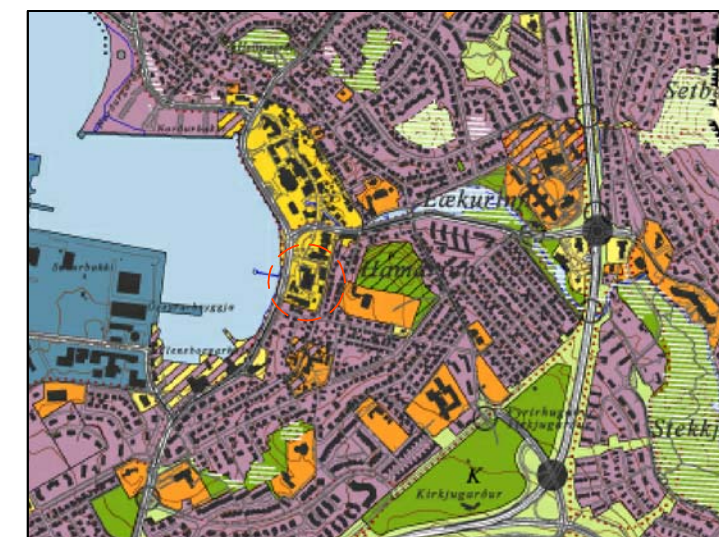
HLUTI AF AÐALSKIPULAGI HAFNARFJARDAR 2005-2025