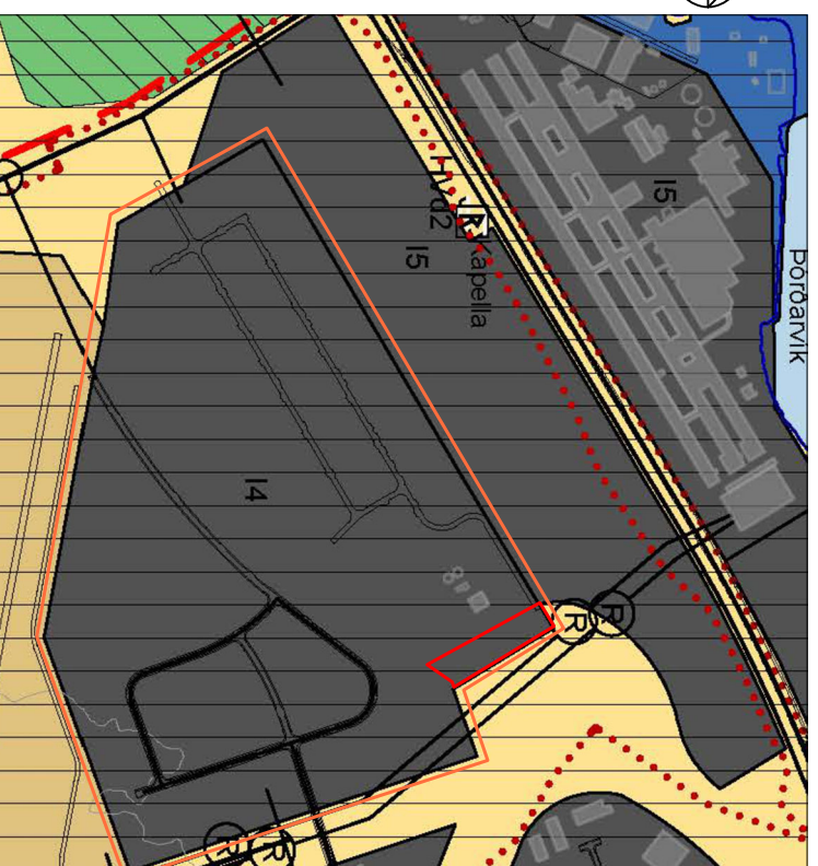
Mörk breytinga Mörk skipulagsvæðis