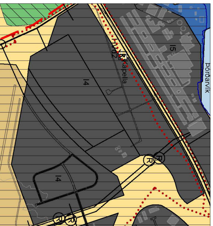
Adalskipulag Hafnarfjarðar 2013-2025 Staðfest af skipulagsstofnun 10.07. 2014, með áorðnum breytingum.

Stærðarbreyting á landnýtingaflokkum: Íbúðarsvæðið 14 stækkar inn á óbyggð svæði um 1,2ha til austurs vegna stækkunar lóðarinnar Álhelli 1.