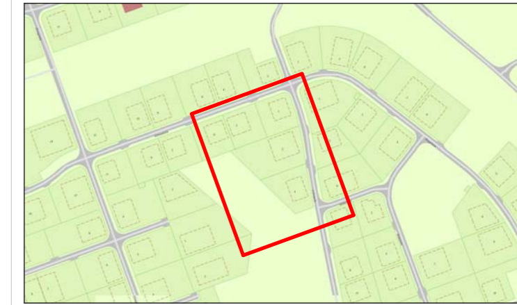
Hellnahraun 3. áfanga - Deiliskipulag