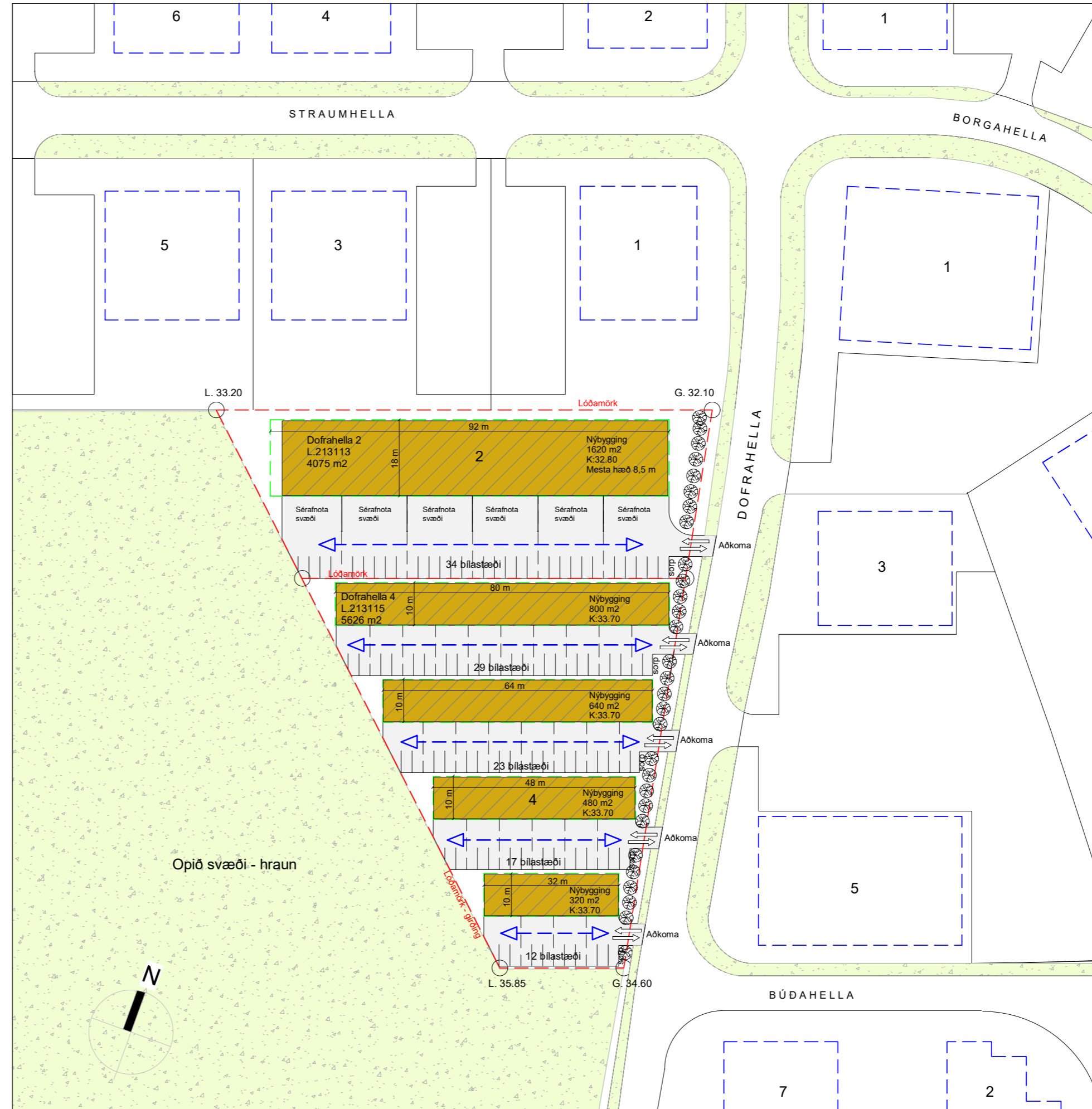
Afstöðumynd - deiliskipulag eftir breytingu - maí 2019 mkv.: 1 : 1000

Nýtingarhlutfall: Nýtingarhlutfall lóðanna heist óbreytt (0.5) eftir breytingu.