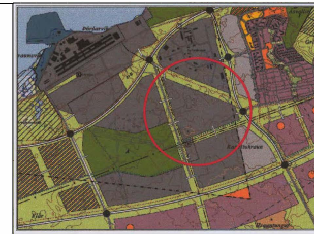
Yfirlit - Hluti aðalskipulags Hafnarfjarðar 2013-2025