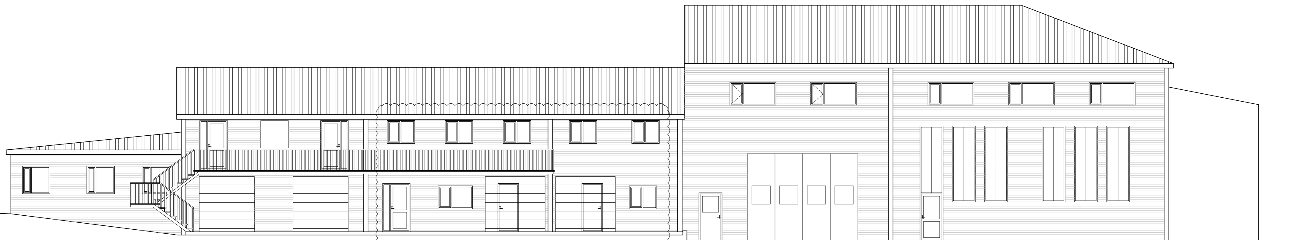
Útlit Austurhlíð, eftir breytingu m.kv. 1:100