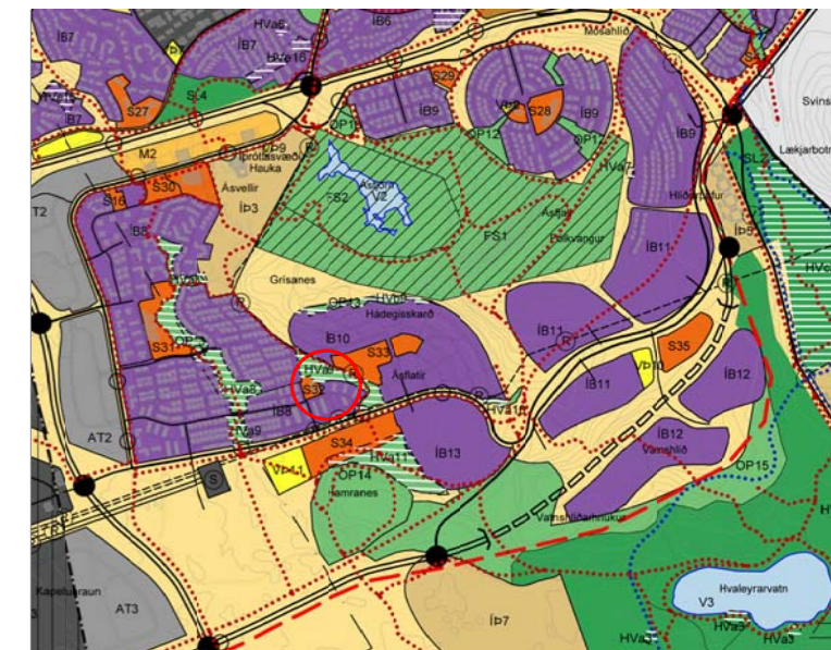
Aðalskipulag Hafnarfjarðar 2013-2025