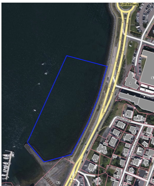
Hamarshöfn fyrir breytingu

Breytingin á Hamarshöfn H6 er gert ráð fyrir að fyrirhugaður hafnargarður færist lengra til norðurs. Í gildandi aðalskipulagi er fyrirhugaður hafnargarður á mótis við Víkingarstræti. Í breytingunni er er gert ráð fyrir að hafnargarðurinn færist um 20 m til norðurs og nær þá að nyrðri enda íþróttahússins við Strandgötu 53.