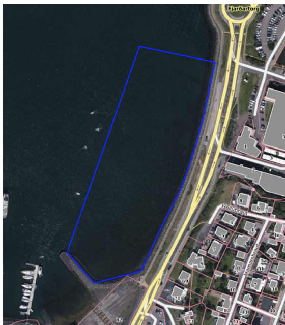
Hamarshöfn eftir breytingu