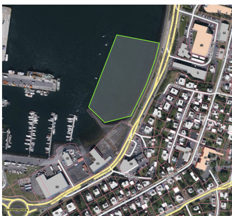
Loftmynd sem sýnir afmörkun miðshafnarsvæðis H6

Hafnarsvæðið H6 Hamarshöfn, afmarkast af Flensborgarhöfn í átt að miðbæ meðfram Strandgötu að Víkingarstræti.