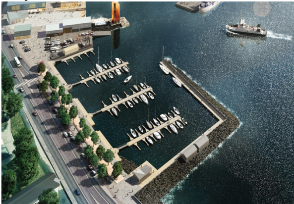
Úr rammaskipulagi Flensborgarhafnar og Óseyrarsvæðis

Landnotkunarflokkur verði H6 (hafnarsvæði). Hamarshöfn verði ný lystibátahöfn á landfyllingu við sjávarbakka sem liggur frá Flensborgarhöfn í átt að miðbæ meðfram Strandgötu að Víkingastræti. Þannig verði mögulegt að stækka smábátahöfnina og styrkja tengsl miðbæjar og hafnarsvæðis. Reiturinn nær einnig til hafnarbakkans meðfram Flensborgarhöfn (5 m inn á land). Þar verði ýmis þjónusta við hafnarstarfsemina.