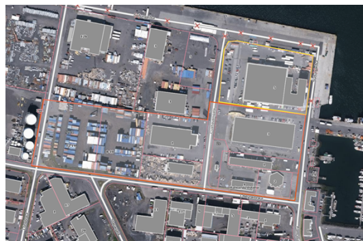
Miðsvæði M7 og svæði fyrir samfélagsþjónustu S42 eftir breytingu