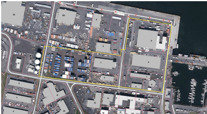
Loftmynd sem sýnir afmörkun miðsvæðis M7

Miðsvæðið M7 afmarkast af Óseyrarbraut, Fornubúðum, og lóðarmörkum Óseyrarbrautar 12B og Cuxhavengötu 3, Háabakka og Suðurbakka.