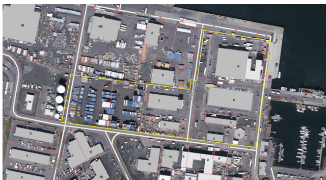
Miðsvæði M7 fyrir breytingu

Eins og kom fram í inngangi hér að ofan gengur fyrirhuguð aðalskipulagsbreyting út á að breyta miðsvæðinu M7 að hluta til í svæði fyrir samfélagsþjónustu. Í dag er Miðsvæðið M7 6,8 ha en verður eftir breytingu 1,5 ha. Svæði samfélagsþjónustu S42 verður 5,3 ha.