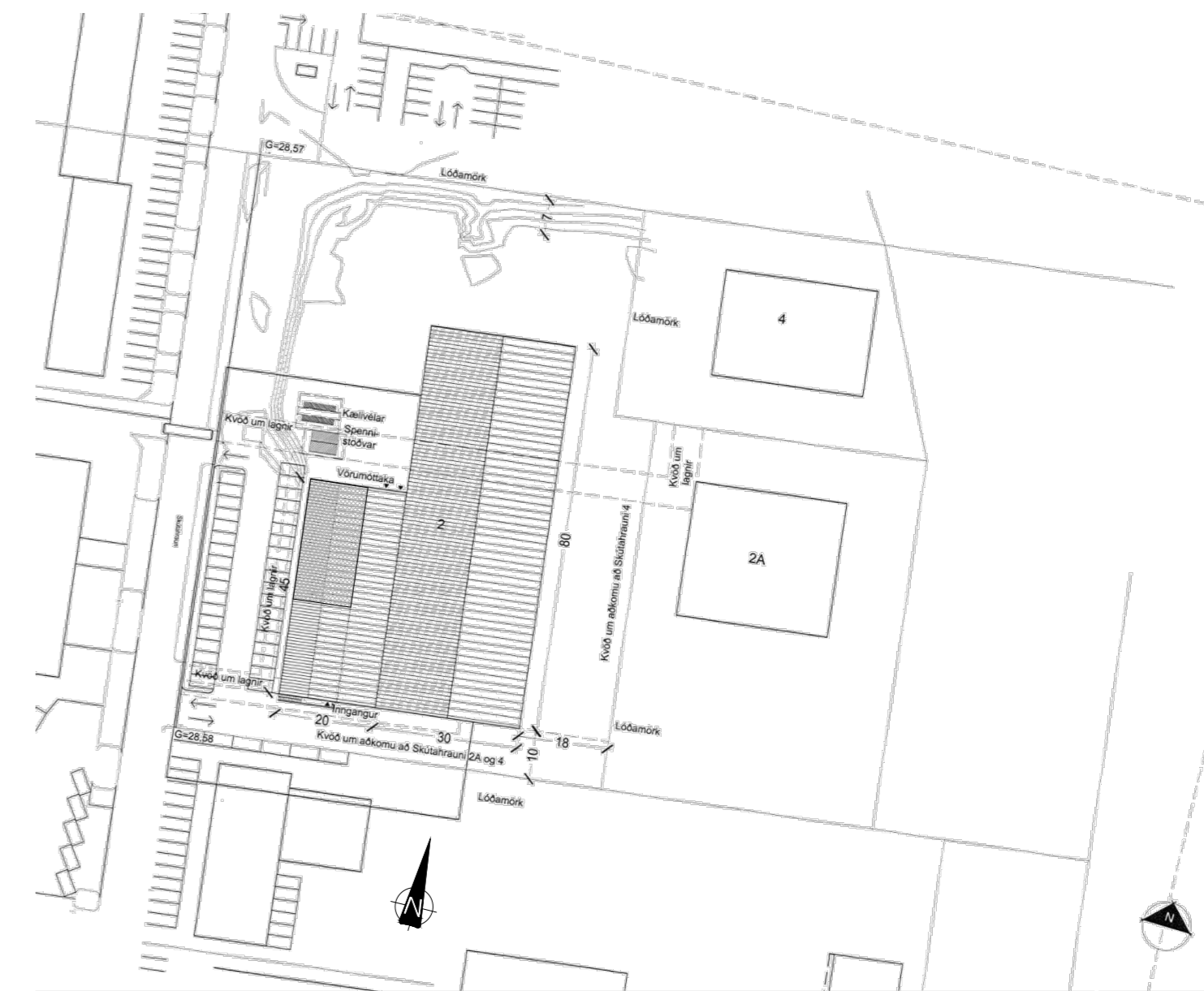
Afstöðumynd 1 : 500