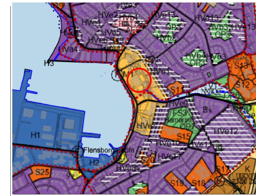
Skýringar: Aðalskipulag 2013-2025