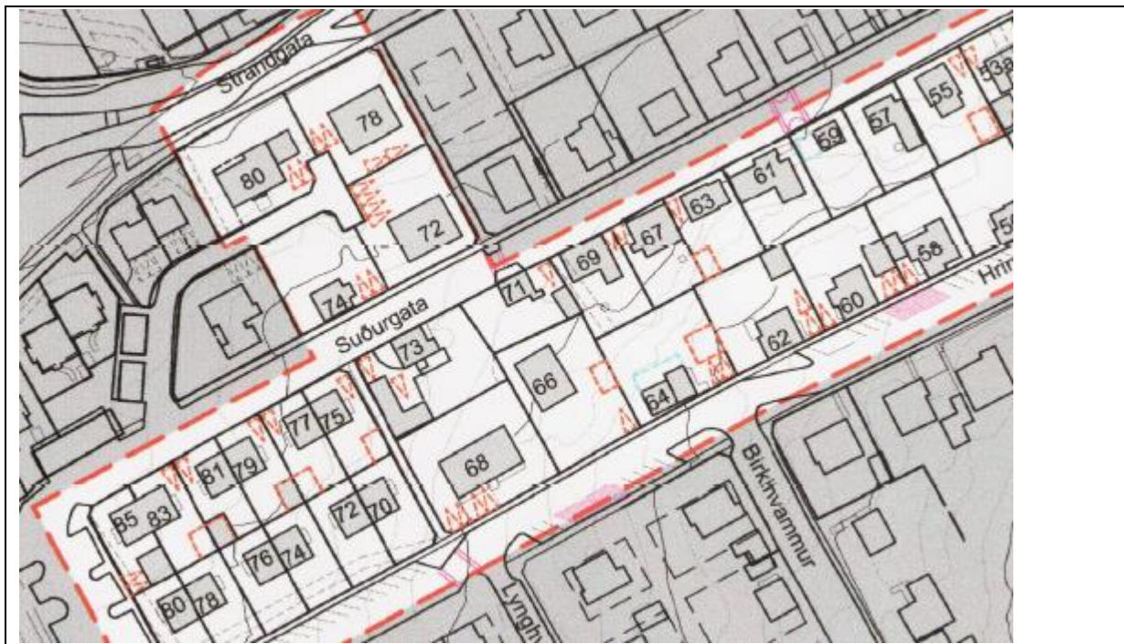
Hlutamynd úr gildandi deiliskipulagi frá 2014.

Í gildi er deiliskipulag frá 2014, sem gerir ráð fyrir tveimur bílastæðum á lóð. Fyrirliggjandi umsókn gerir ráð fyrir fjölgun bílastæð um þrjú þannig að heildar fjöldi bílastæða á lóð verði samtals 5.