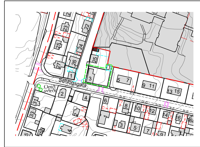
EFTIR BREYTINGU MKV. 1:2000