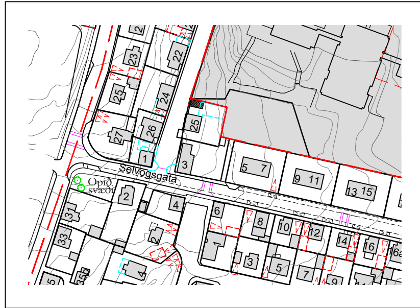
FYRIR BREYTINGU MKV. 1:2000 Hluti af gildandi deiliskipulagi frá 7.7.2014.