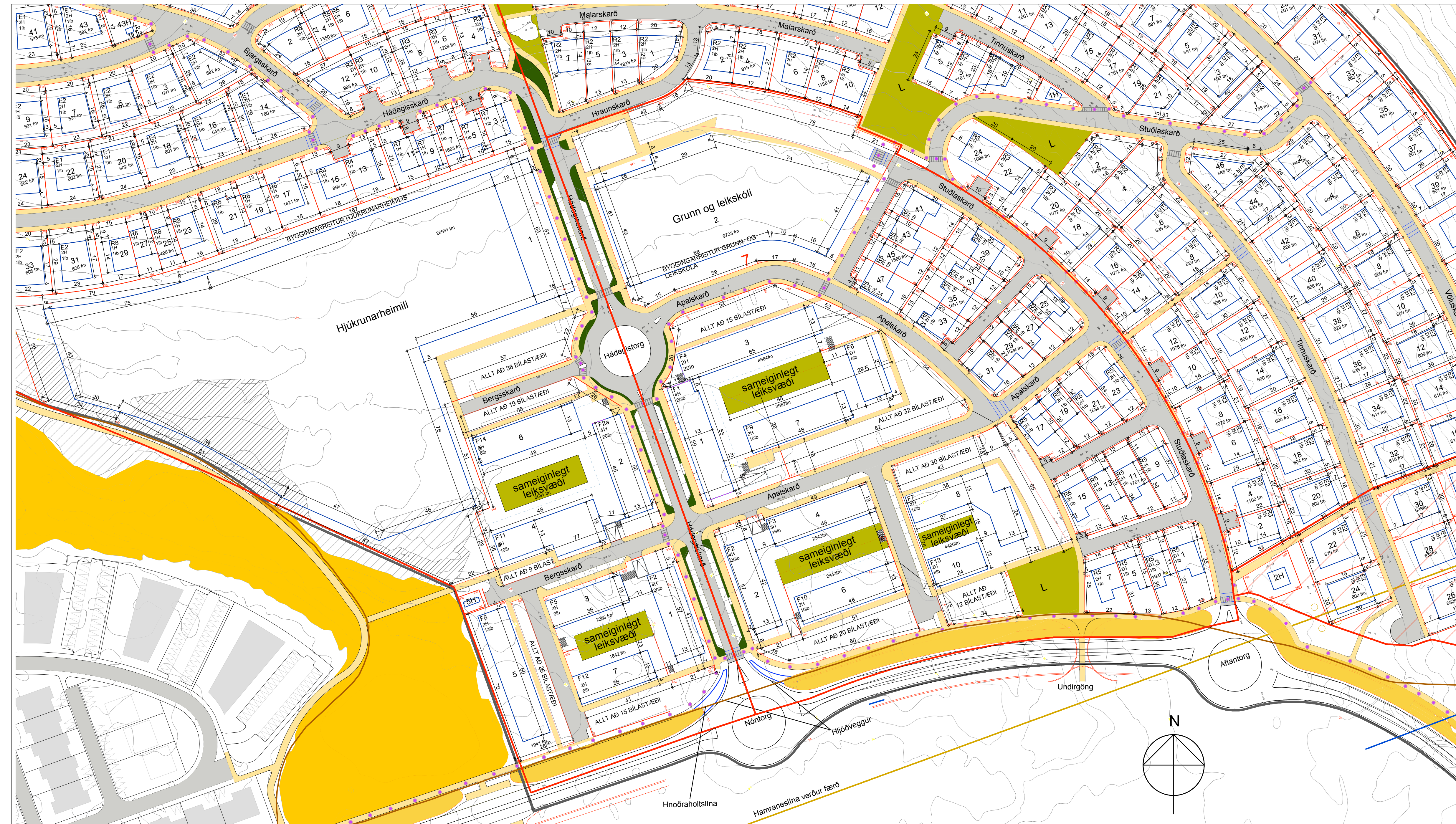
GILDANDI DEILISKIPULAG SKARÐSHLÍÐAR, HLUTAMYND MKV. 1:1000 SAMPYKKT: 10.06.2013