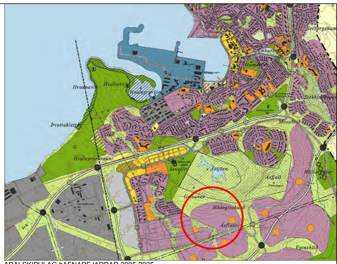
ADALSKIPULAG HAFNARFJÖRDAR 2005-2025