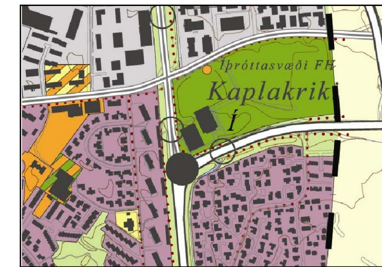
ADALSKIPULAG HAFNARFJARÐAR 2005-2025

Hámarksnýtingarhlutfall á lóð er 0,36 fyrir utan bilastæðahús