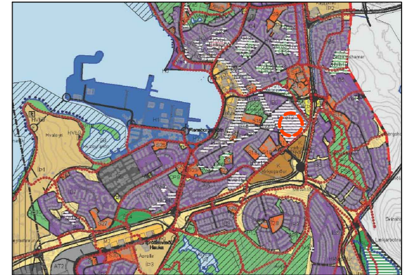
Aðalskipulag Hafnarfjarðar 2005-2025 ----- STADSETNING Í BÆJARLANDINU

Hámarks mænishæð húss á lóð nr. 23 við Bröttukinn má vera 7,5 m þar sem húsið/ byggingareiturinn er lægstur við götu. Heimilt er að gera kvist í byggingarlínu samsíða götu sem nemur allt að 55% af lengd veggjar. Breyting þessi hefur óveruleg áhrif á skuggavarp á næstu lóðir og varðar aðeins Bröttukinn 23, Hafnarfirði. Að öðru leyti gilda skilmálar deiliskipulags Kinna samþykkt í bæjarráði, í umboði bæjarstjórnar þann 26. júlí 2007. Skipulagið öðlaðist gildi 4. sept. 2007.