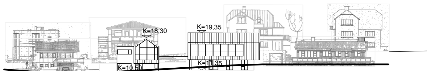
Götumynd eftir breytingar