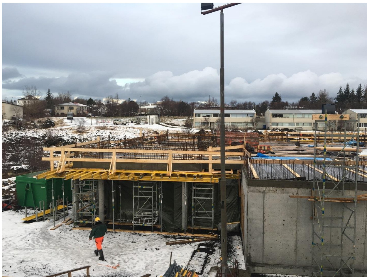
Vettvangsmynd fundardag. (Búið að steypa plötu yfir kjallara,vesturenda.)