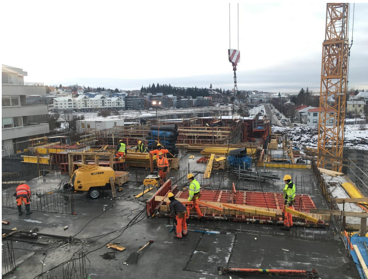
Vettvangsmynd fundardag. (Horft frá 3.hæð úr austurhluta. Í forgrunni unnið við uppslátt veggja 2.hæðar austurhluta . Fjarst er uppsteypa veggja 1.hæðar á lokastigi.)