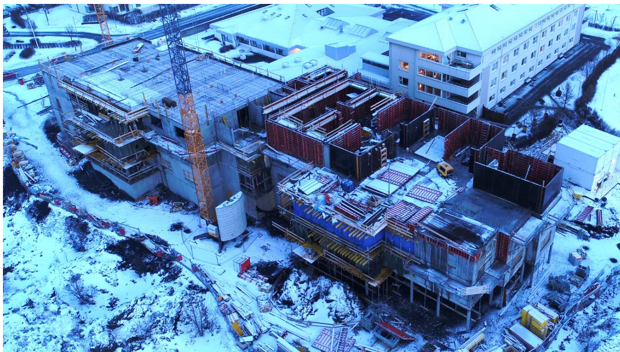
Vettvangsmynd þann 20.02.18. (Yfirlitsmynd af nýbyggingu. Búið er að steypa u.þ.b 60% af veggjum 3.hæðar. Unnið er að járnbindingu á plötu yfir 3.hæð í austurhluta og uppslætti veggja í vesturhluta.)

Nr. FUNDARGERÐ: Frestur: Ábm.: Skáletraður texti er óbreytt bókun frá síðasta fundi.