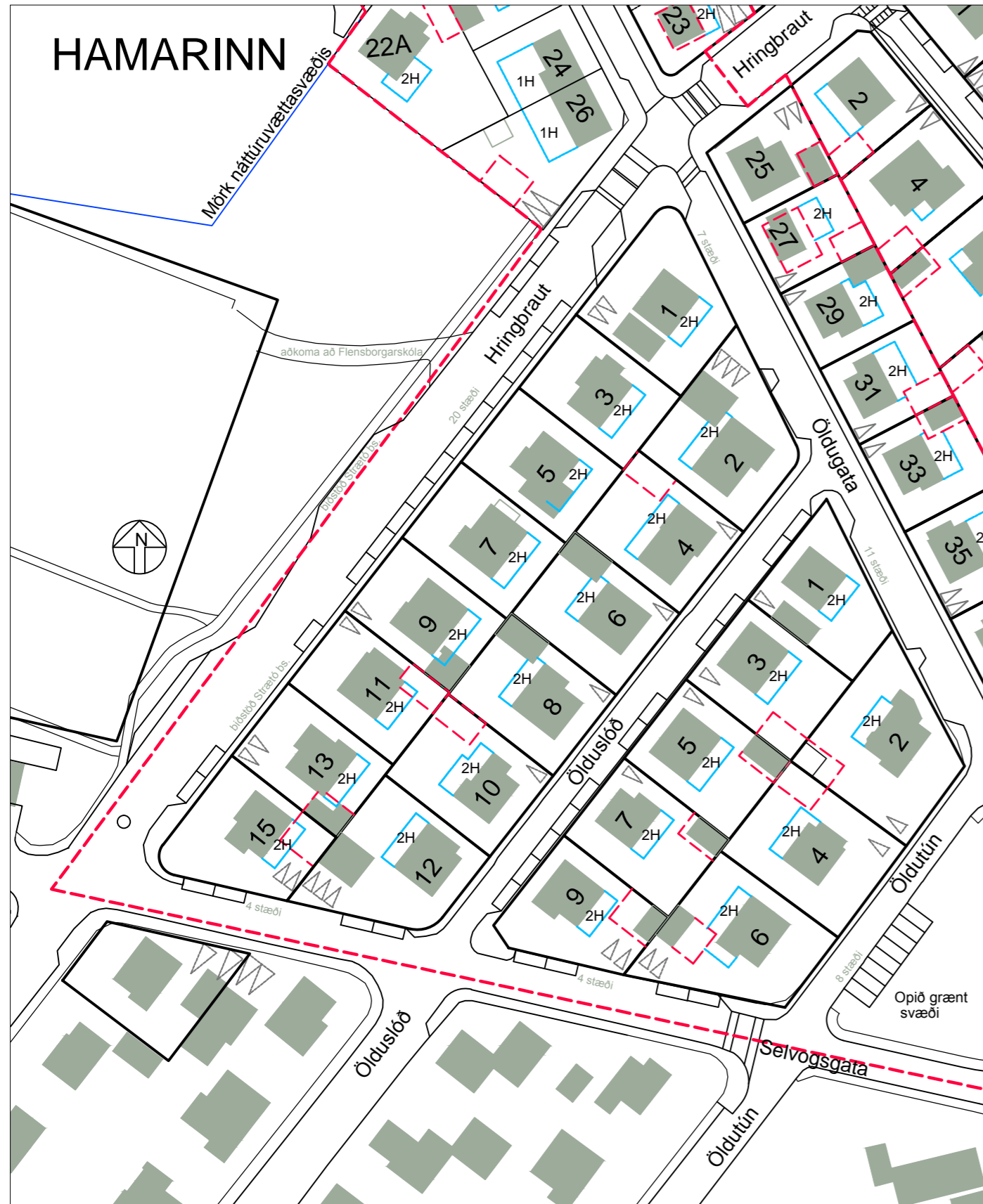
NÚGILDANDI DEILISKIPULAG SAMÞYKKT Í BÆJARSTJÓRN HAFNARFJARÐAR 25.11.2008