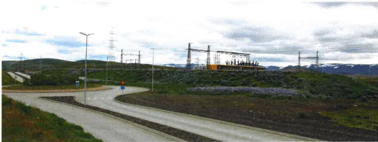
Mynd 2. Núverandi útlit manar séð frá Ásvallabraut.