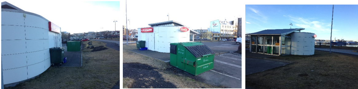
Núverandi aðstæður við Pylsubarinn

Manning ehf óskar með bréfi dags. 14.3.2017 eftir lóðarstækkun v. sorpgáms eða heimildar til að staðsetja hann utan lóðar.