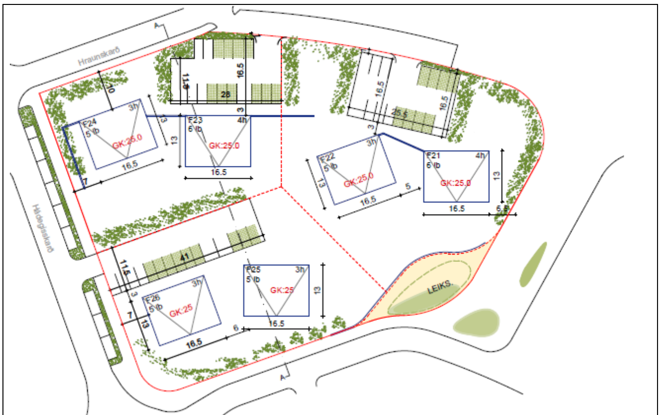
Hlutamynd úr gildandi deiliskipulagi.

Með bréfi dags. 11.01.2018 óskar Bjarg íbúðarfélag eftir heimild til að fjölga íbúðum úr 42 í 54 í þremur húsum í stað sex á reit 7.