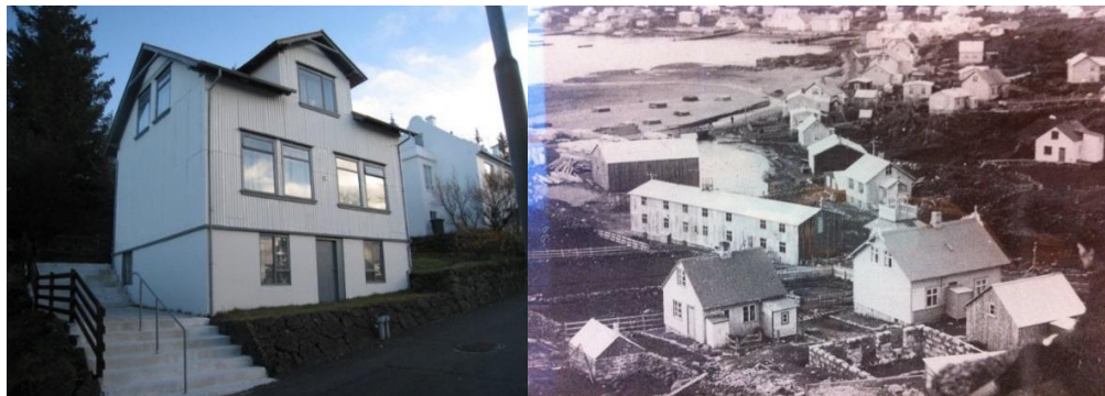
Horft í suðsuðaustur.