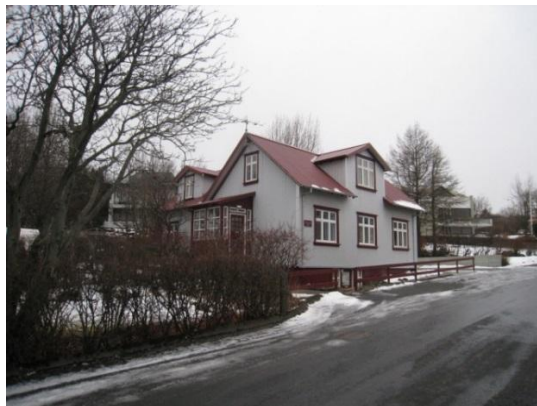
Horft í suður.