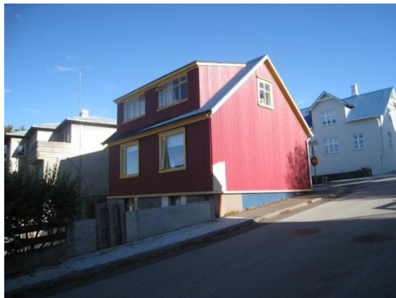
Horft í norðaustur.