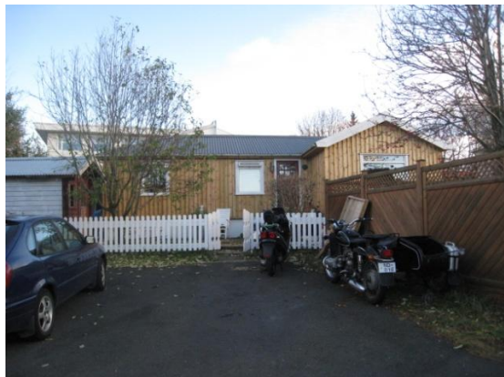
Horft í suður.