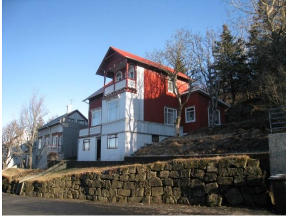
Horft í austur.