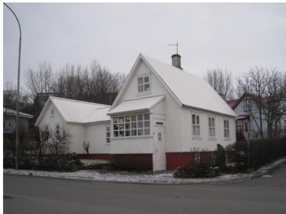
Horft í vestur.