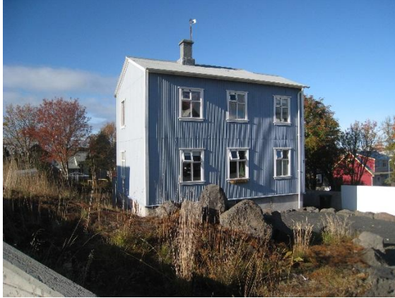
Horft í vestur.