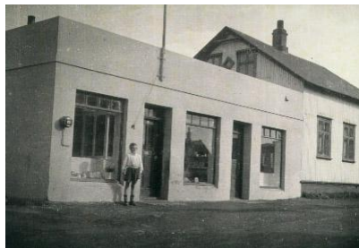
Horft í suðsuðvestur.