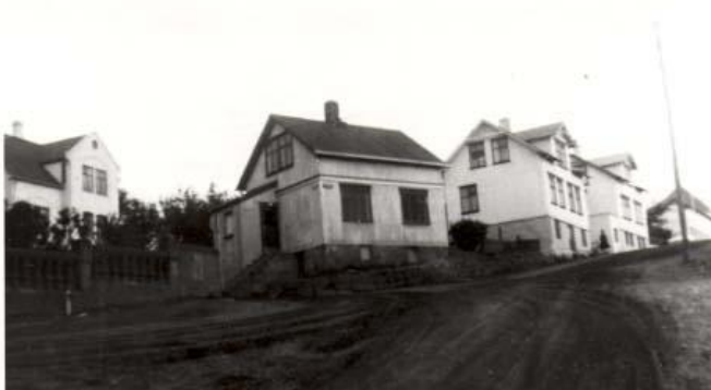
Horft í suður. Húsið sem er fremmst á myndinni er Suðurgata 29 en það húsi er horfið í dag en hin húsin eru Suðurgata 31 og 33 standa enn, einnig sést í gaflinn á Gíslabúð. Lengst til vinstri er Hliðabraut 2.