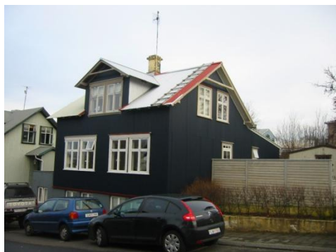
Horft í norður.