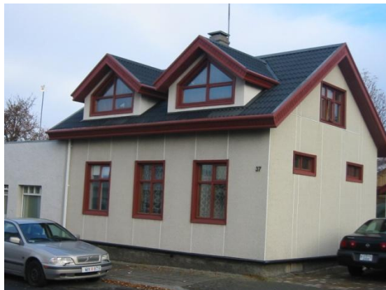
Horft í norðaustur.