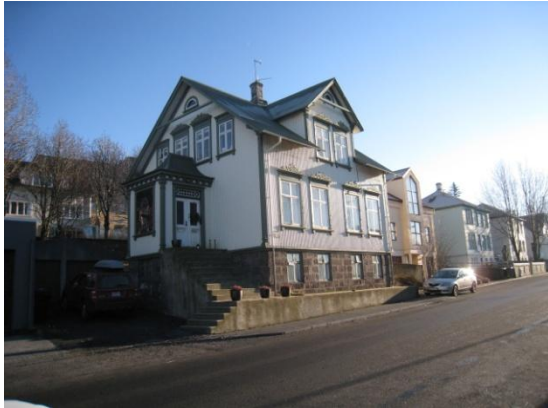
Horft til suðausturs.