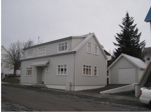
Horft í norðaustur.