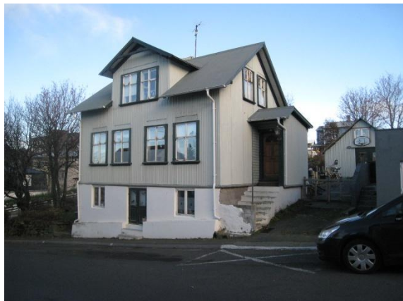
Suðurgata 31, var áður Suðurgata 5.