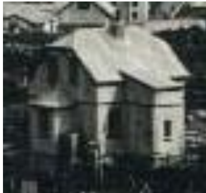
Bakhlið, horft til vesturs ljósmynd frá 1912.