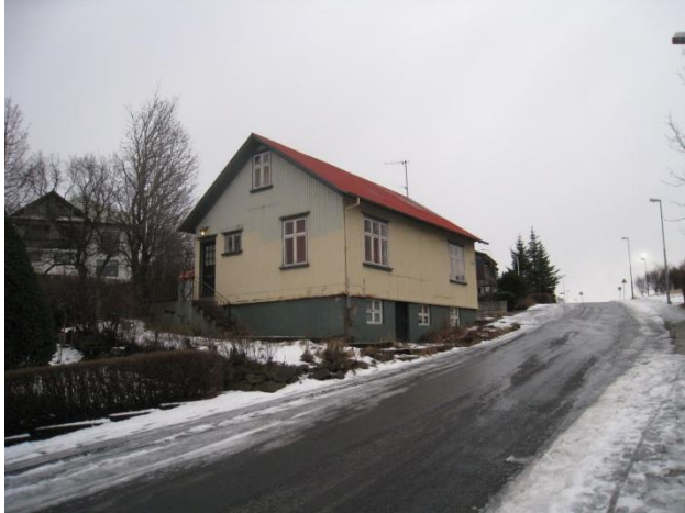
Horft í suður.