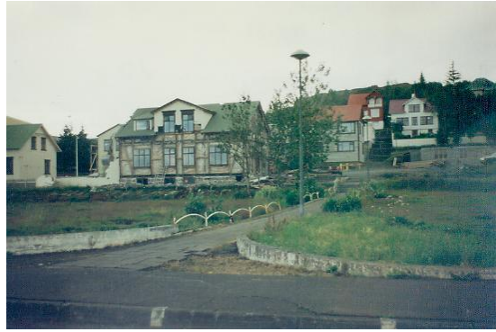
Sýslumannshúsið þegar að stóð við Suðurgötu 8. Horft í austur.