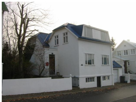
Framhlið. Horft til suðurs.