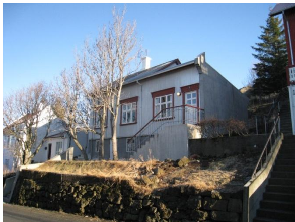
Horft í austur.