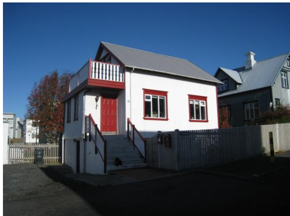
Horft í suð suðaustur.