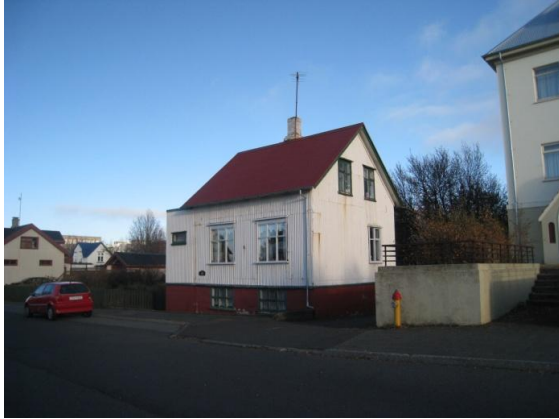
Horft í austur.