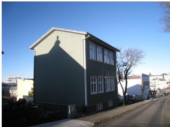
Horft í norður.