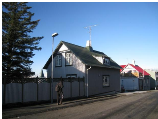
Horft í norður, götuhlið.