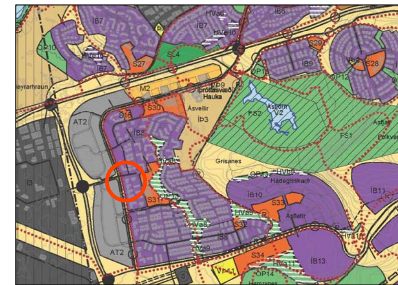
Aðalskipulag Hafnarfjarðar 2005-2025

Deiliskipulag þetta sem fengið hefur meðferð í samræmi við ákvæði 43. gr. skipulagslaga nr.123/2010 var samþykkt í Skipulags- og byggingarráði Hafnarfjarðar þann 2016.