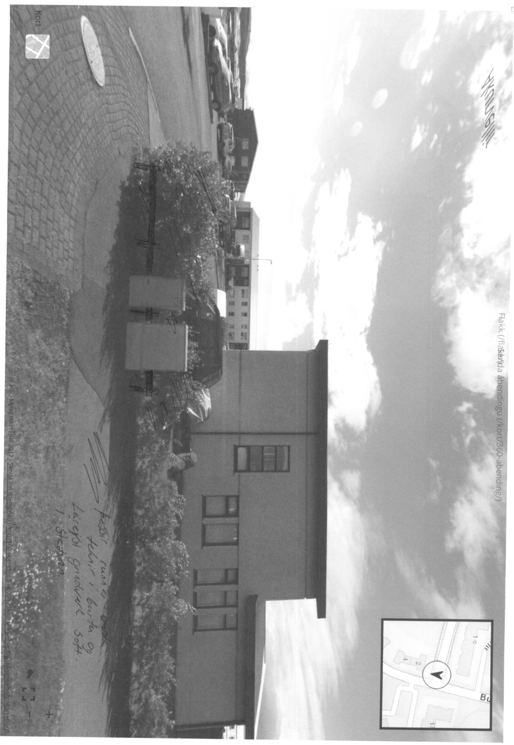
Flakk (flaskada áþendingu (kort/360-áþending))