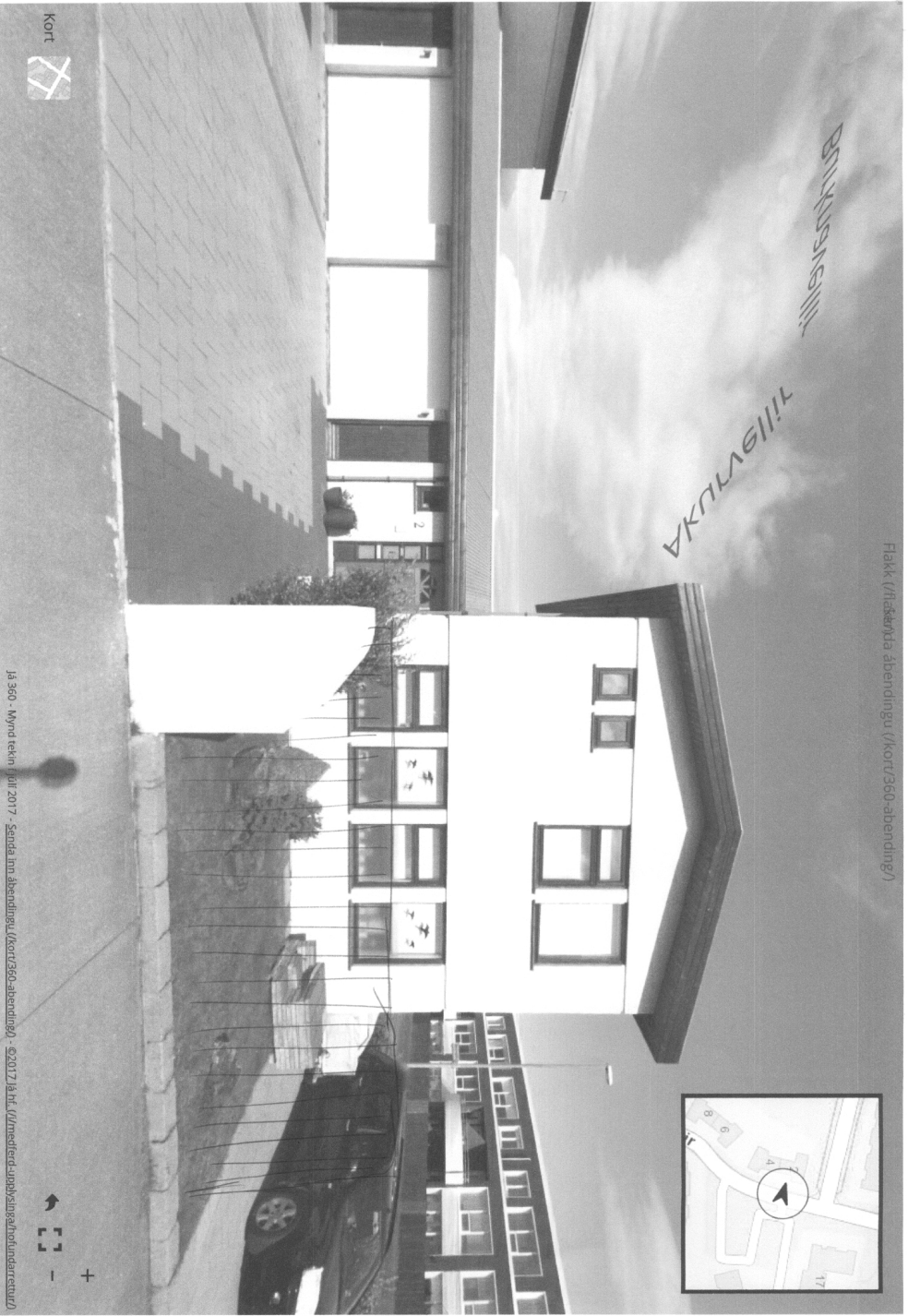
Flak (flakenda ábendingu (/kort/360-ábending/))

Ís 360 - Mynd tekni. Júní 2017 - Senda inn ábendingu (/kort/360-ábending/) - ©2017 Ís hl. (/mei/erf-urppl/singur/undarrettu/)