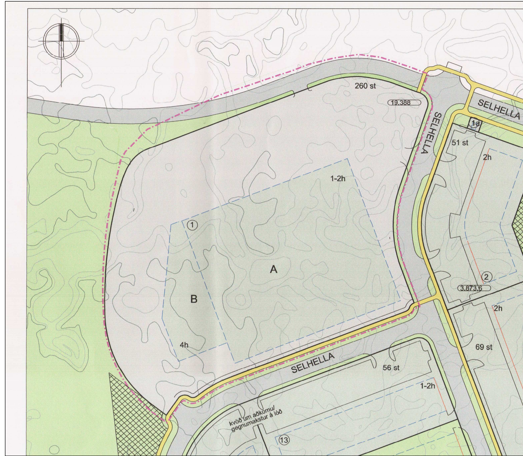
Gildandi deiliskipulag fyrir lóðina Selhella 1: