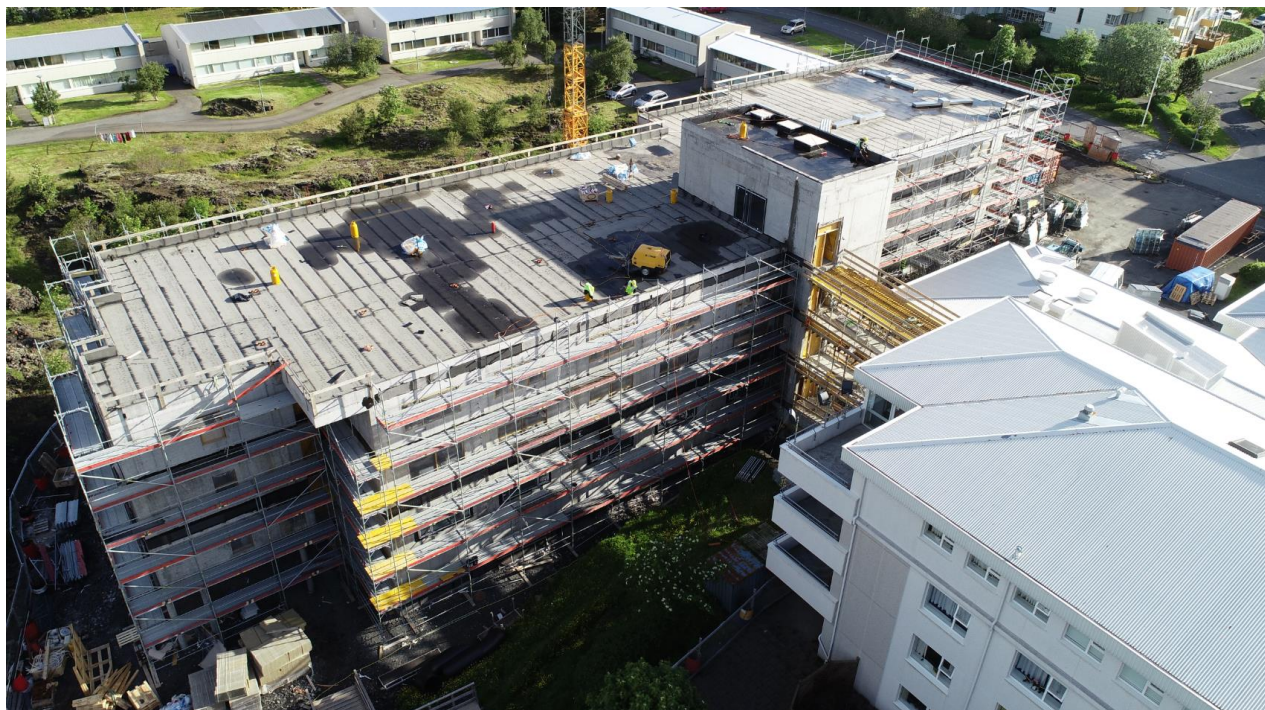
Vettvangsmynd 05.07.2018. ( Bygging er uppsteypt að frátöldum 6stk súlum 3.hæðar og plötu yfir 3.hæð og þakplötu tengingangs. Niðurlögn rakavarnarlags á þakplötu er nánast lokið ).