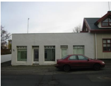
Horft í suður.