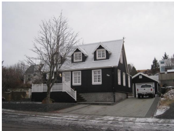
Horft í suðaustur.