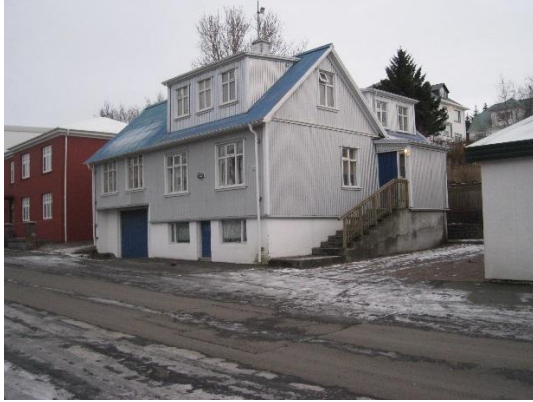
Horft til norðurs.