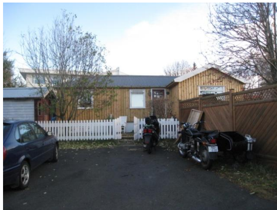
Horft í suður.