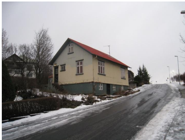
Horft í suður.