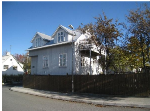
Horft í norðaustur.