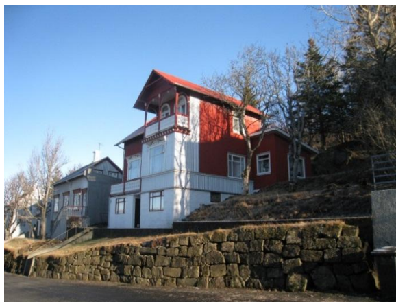
Horft í austur.