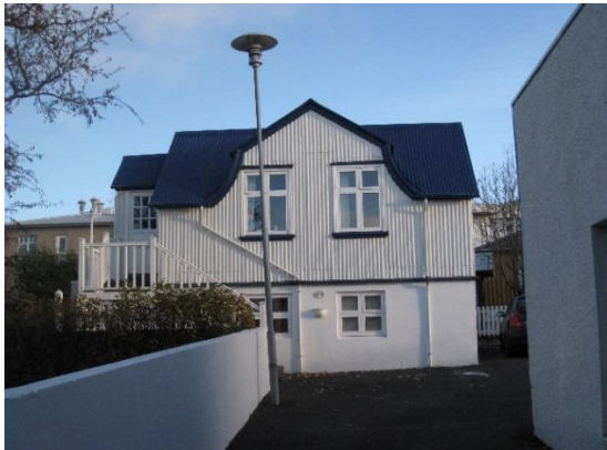
Suðurgata 35b, mynd 2012. Horft í suður.