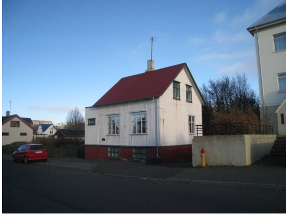
Horft í austur.