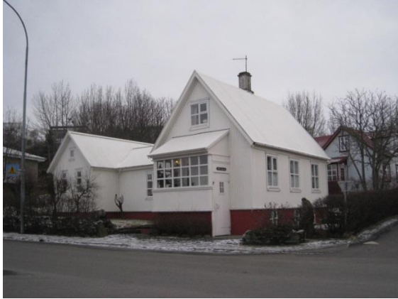
Horft í vestur.