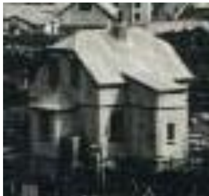
Bakhlið, horft til vesturs ljósmynd frá 1912.