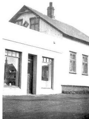
Horft í suðsuðvestur.