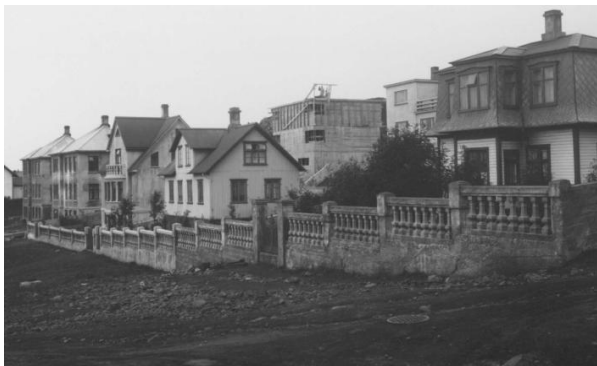
Horft í norður, eftir Suðurgötunni eftir 1931.