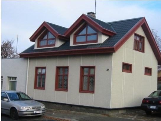
Horft í norðaustur.