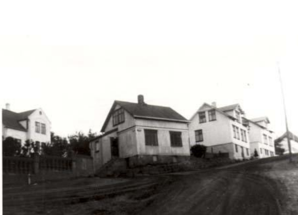
Húsið sem er fremmst á myndinn er Suðurgata 29 en það hús er horfið í dag en hin húsin eru Suðurgata 31 og 33 standa enn, einnig sést í gaflinn á Gíslabúð. Lengst til vinstri er Hliðabraut 2.