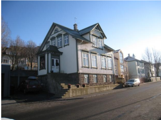
Horft til suðausturs.