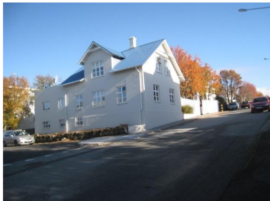
Horft í suðaustur.