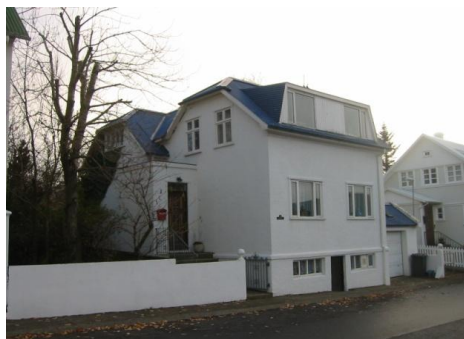
Framhlið. Horft til suðurs.