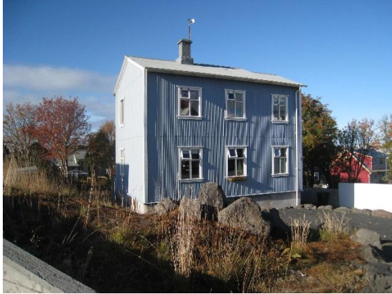
Horft í vestur.