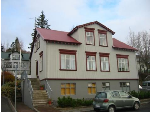
Sýslumannshúsið við Suðurgötu 11. Horft í norður.