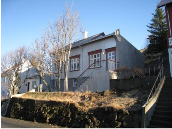
Horft í austur.