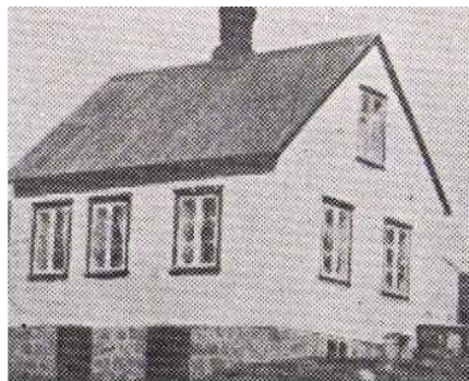
Horft í austur.