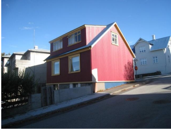
Horft í norðaustur.