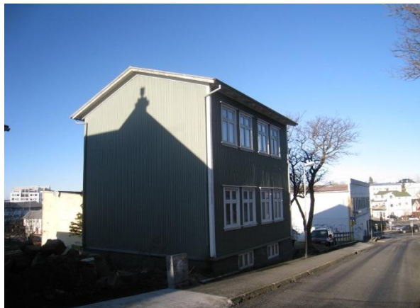
Horft í norður.