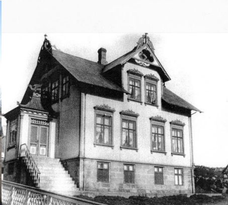
Horft til suðausturs.