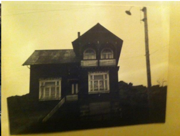
Horft í auðsuðaustur.