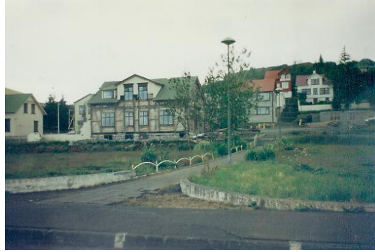
Sýslumannshúsið þegar að stóð við Suðurgötu 8. Horft í austur.