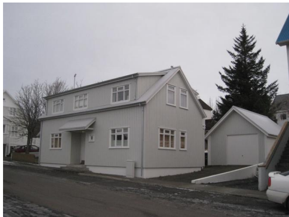
Horft í norðaustur.