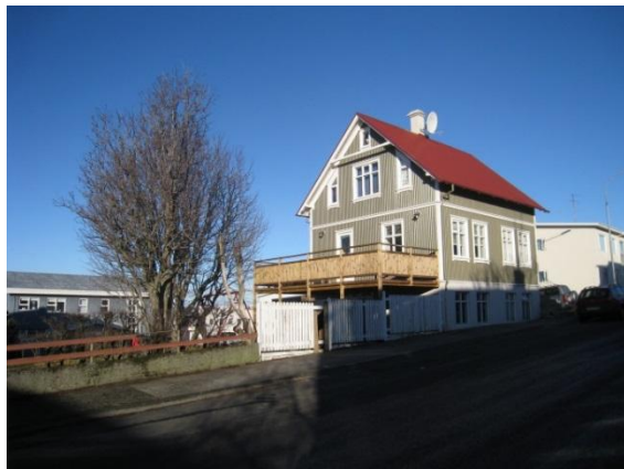
Horft í norður