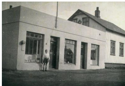
Horft í suðsuðvestur.