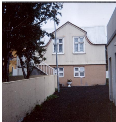
Suðurgata 35b, mynd frá 1991. Horft í suður.