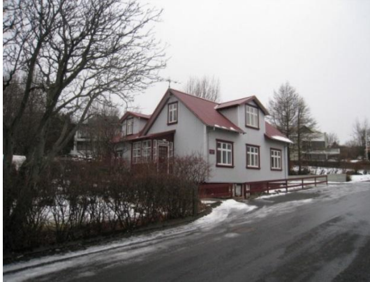
Horft í suður.