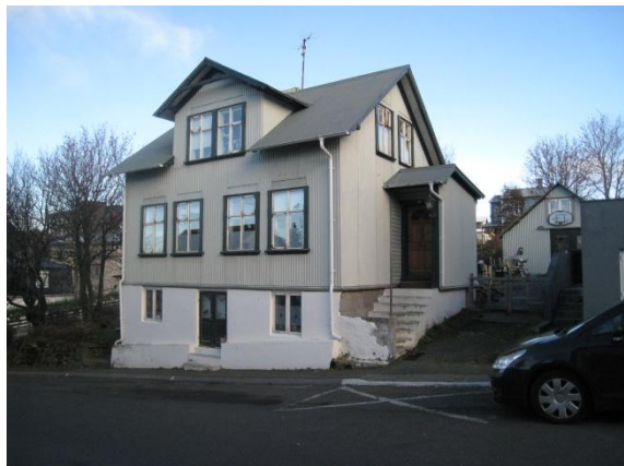
Suðurgata 31, var áður Suðurgata 5.