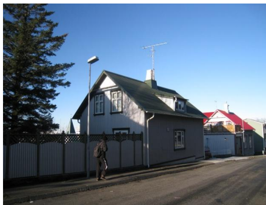
Horft í norður, götuhlið.