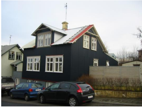
Horft í norður.