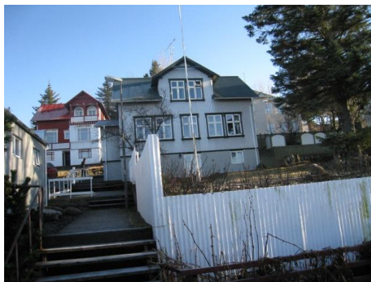
Horft í austur, bakhlið.