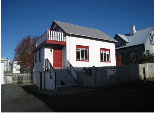
Horft í suð suðaustur.