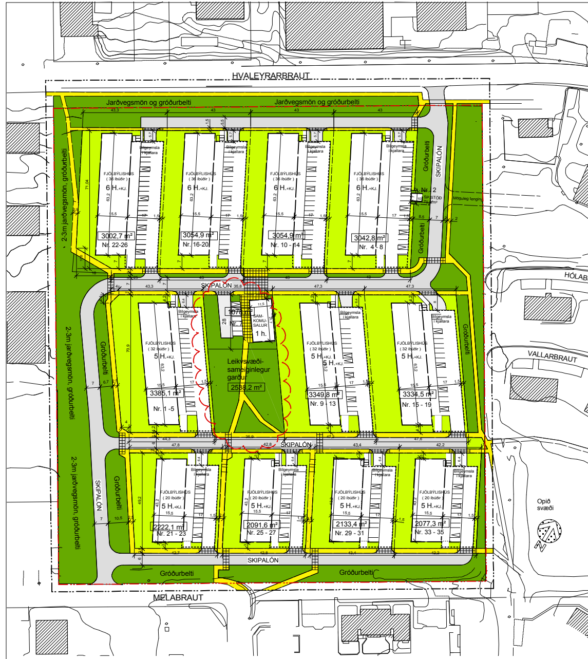
DEILISKIPULAG - fyrir breytingu mkv. 1 : 1000

Garður og leiksvæði fyrir alla íbúana verður eftir sem áður, og göngustígur í gegnum garðinn.