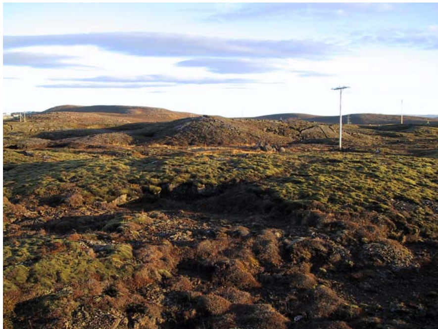
Horft að Grísanesi

Deiliskipulagið er sett fram í greinargerð þessari ásamt skipulagsuppdrætti og skýringaruppdrætti. Skipulagsuppdráttur er í mælikvarða 1:1000, dags. 07.07.2005, þar sem settir eru fram helstu þættir skipulagsins.