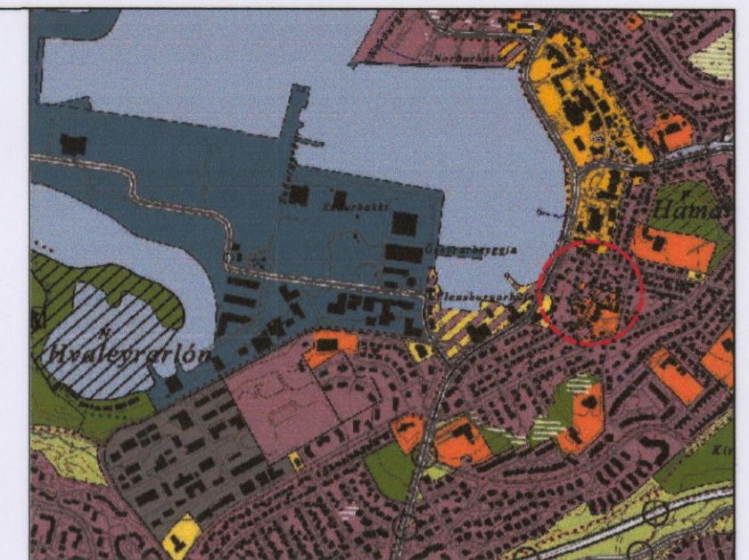
HLUTI GILDANDI ADALSKIPULAGS HAFNARFJARÐAR 2005-2025