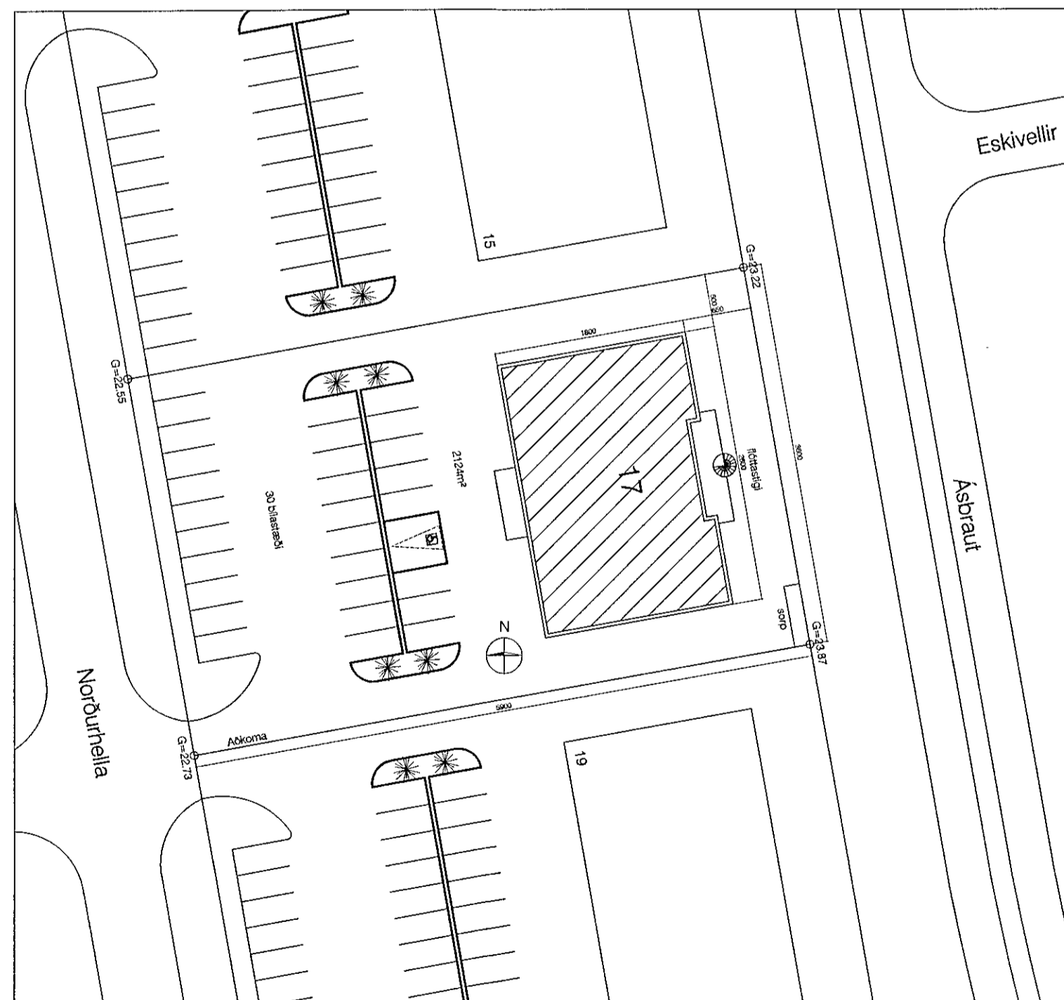
Yfirlitsmynd - 1:500