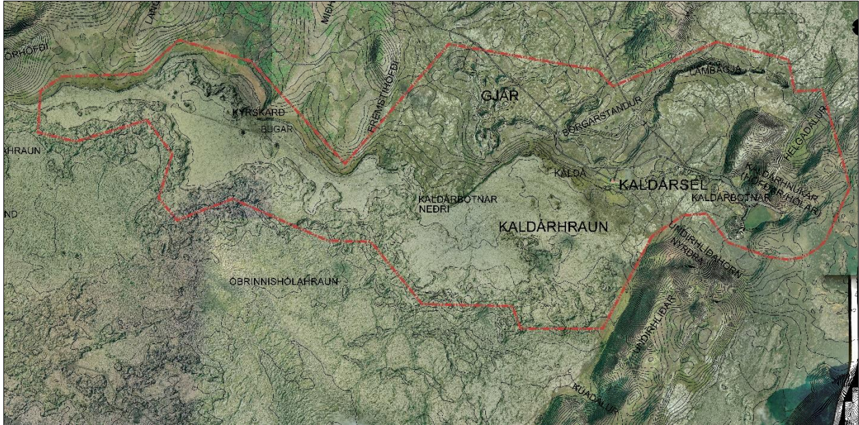
Mynd 1. Afmörkun skipulagssvæðisins