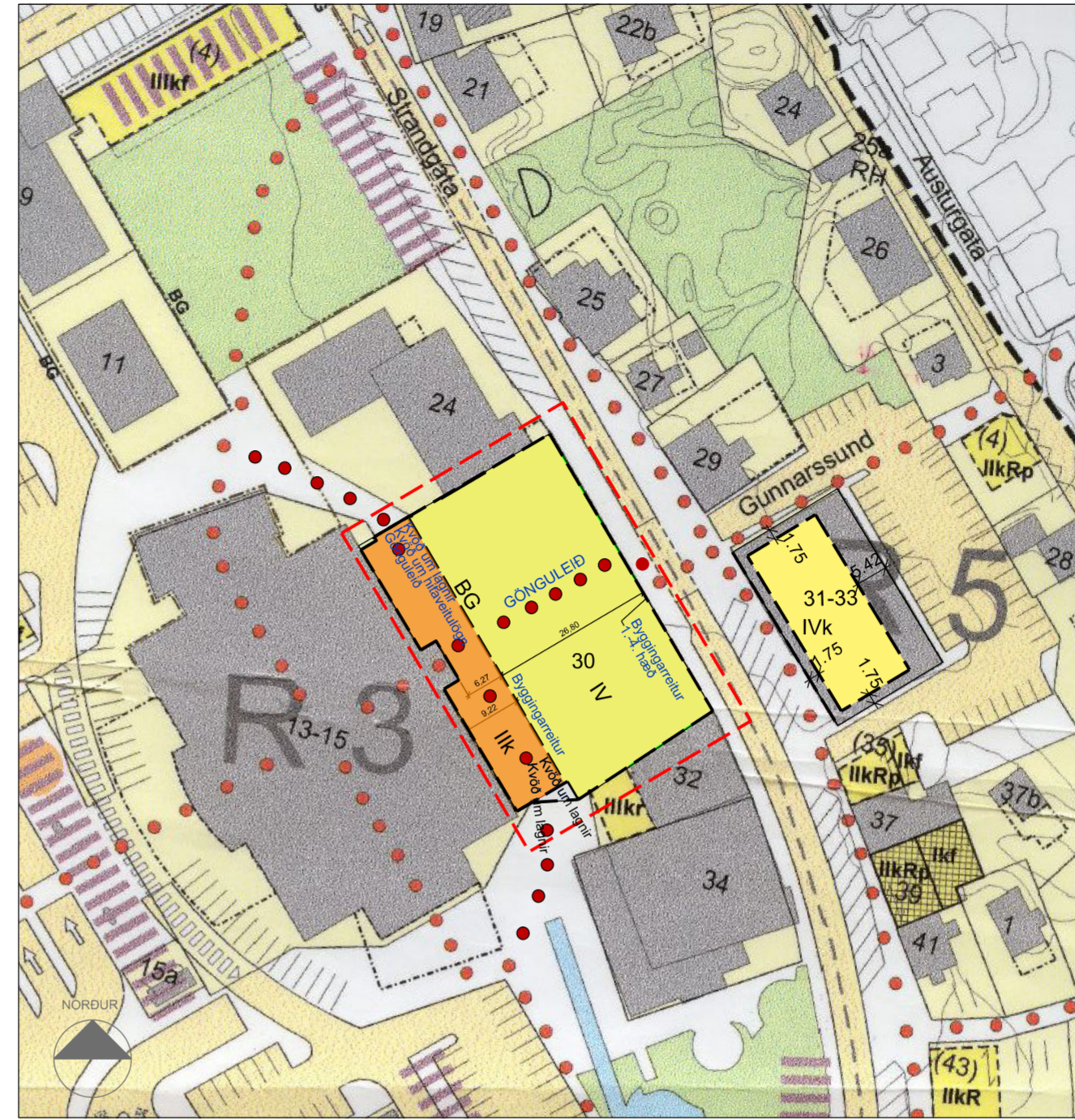
Tillaga að breytingu á deiliskipulagi Mkv. 1:1000

Að öðru leyti gilda áfram sömu skilmálar.