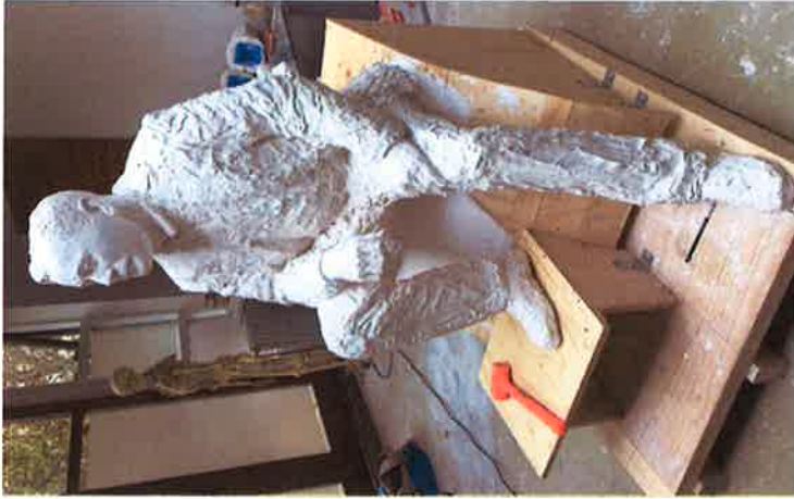
FRUMGERÐ STYTTU - Ragnhildur Stefánsdóttir