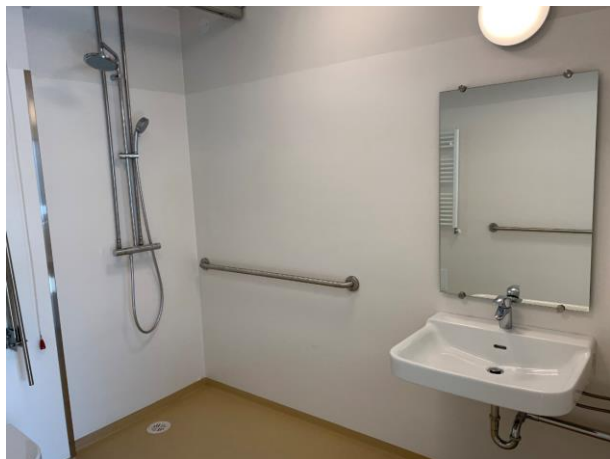
Ljósmyndir af verkstað.