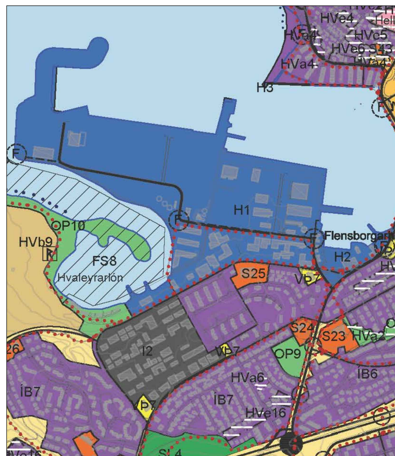
Aðalskipulag Hafnarfjarðar 2013-2025 Staðfest af skipulagsstofnun 10.07. 2014