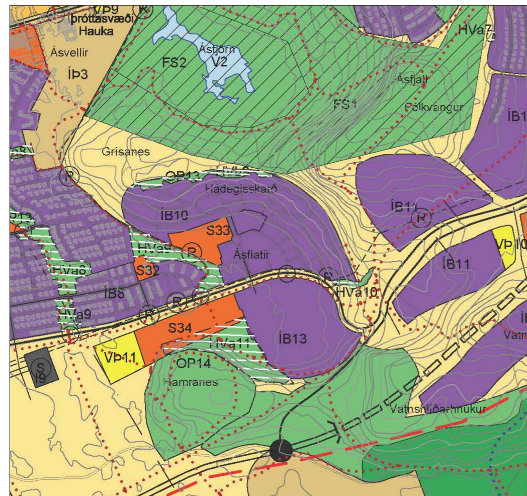
Aðalskipulag Hafnarfjarðar 2013-2025 Staðfest af skipulagsstofnun 10.07. 2014 Með áorðnum breytingum. 1:15.000