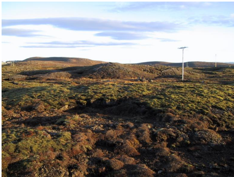
Horft að Grísanesi

Deiliskipulagsáætlunin er sett fram í greinargerð þessari ásamt skipulagsuppdrætti, skýringaruppdrætti, uppdrætti af hljóðvistarmælingum og skýringarmyndum af, húsagerðum á 4 uppdráttum. Skipulagsuppdráttur er í mælikvarða 1:1000, dags. 12.01.2004, þar sem settir eru fram helstu þættir skipulagsins.