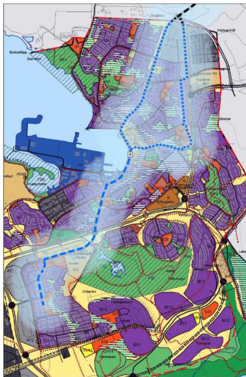
Mynd 4.1 Lega fyrirhugaðs samgöngu- og þróunarsvæðis innan Hafnarfjarðar.

Gert er ráð fyrir að uppbygging og frekari forgangsstöðun á þróunarsvæði Borgarlínu verði nánar útfærð í deiliskipulagi.