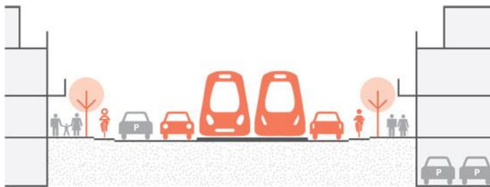
Mynd 2.1 Umhverfi Borgarlínu í miðkjörnum þarf að styðja við alla ferðamáta.

Í fyrsta lagi ferðast vagnarnir á sérakreinum og fá forgang á umferðarljósum. Þannig fæst áreiðanleiki og hraði og ferðatími er samkeppnishæfari við aðra ferðamáta. Í öðru lagi er tíðni ferða mikil. Algeng tíðni vagna á annatímum er 5-7 mínútur en þar sem þörf er á meiri afkastagetu getur hún farið í um 2 mínútur. Í þriðja lagi eru biðstöðvar yfirbyggðar og vandaðar, með farmiðasjálfsölum og upplýsingaskiltum sem sýna í rauntíma hvenær næsti vagn kemur. Aðgengi er fyrir alla þar sem vagnarnir stöðva þétt upp við brautarpalla sem eru í sömu hæð og gólf vagnanna.