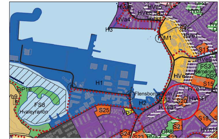
Úrdráttur úr gildandi Aðalskipulagi Hafnarfjarðar 2013 - 2025

Hámarks leyfilegt byggingarmagn er 160 fermetrar. Hámarks nýtingarhlutfall er 0,5. Tvö bílastæði skulu leyst innan lóðar. Leyfilegt er að byggja bílskúr á lóðinni.