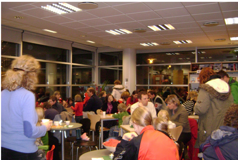
St. Martinsdagur á bókasafninu 2011

Ekki hefur enn verið samin stefna varðandi umgengni starfsfólks við samskiptavefi.