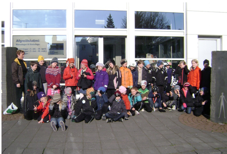
Skólaheimsókn á bókasafnið 2012

Starfsmenn Bókasafns Hafnarfjarðar munu hafa nýtni og sparsemi að leiðarljósi.