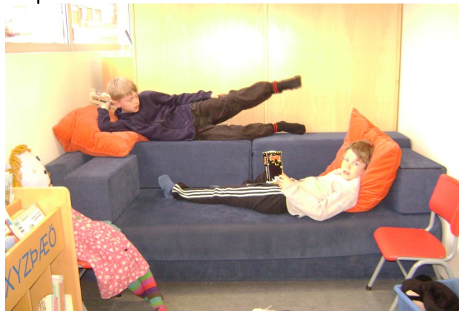
Á barnadeild 2012

Þessir liðir verða uppfærðir í febrúar 2014