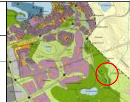
ADALSKIPULAG HAFNARFJARÐAR 2005-2025 Staðsetning í bæjarlandinu

Breytingin felur í sér fjölgun á minni hesthúsum við Fluguskelö. Tvær lóðir bættast við Kaplaskeið nr. 24 og 26 húsagerð 1. Þrjár lóðir verða felldar út við Fluguskelö 1, 2 og 3 og Sörlaskeið 35. Svæði hverfisverndar breytist og stækkar. Númer á húsum breytast: Í stað húsa nr. 8 og 10, húsagerð 4, verði 3 hús nr. 6, 8 og 10, húsagerð 2. Í stað húss nr. 9, húsagerð 4, verði tvö hús nr. 7 og 9, húsagerð 1. Í stað húss nr. 15, húsagerð 4, verði húsagerð 2. Stærðir á lóðum húsa nr. 13 og 15 breytast. Í stað húss nr. 17, húsagerð 4, verði tvö hús nr. 17 og 19, húsagerð 1. Hús nr. 19 við Fluguskelö verði nr. 21. Hús nr. 21 við Fluguskelö verði nr. 23. Að öðru leiti gilda skipulagsskiðmiðjar "Athafnasvæði Hestamannafélags Sörla" útgáfa 0.2, dags. 25.08.2008.