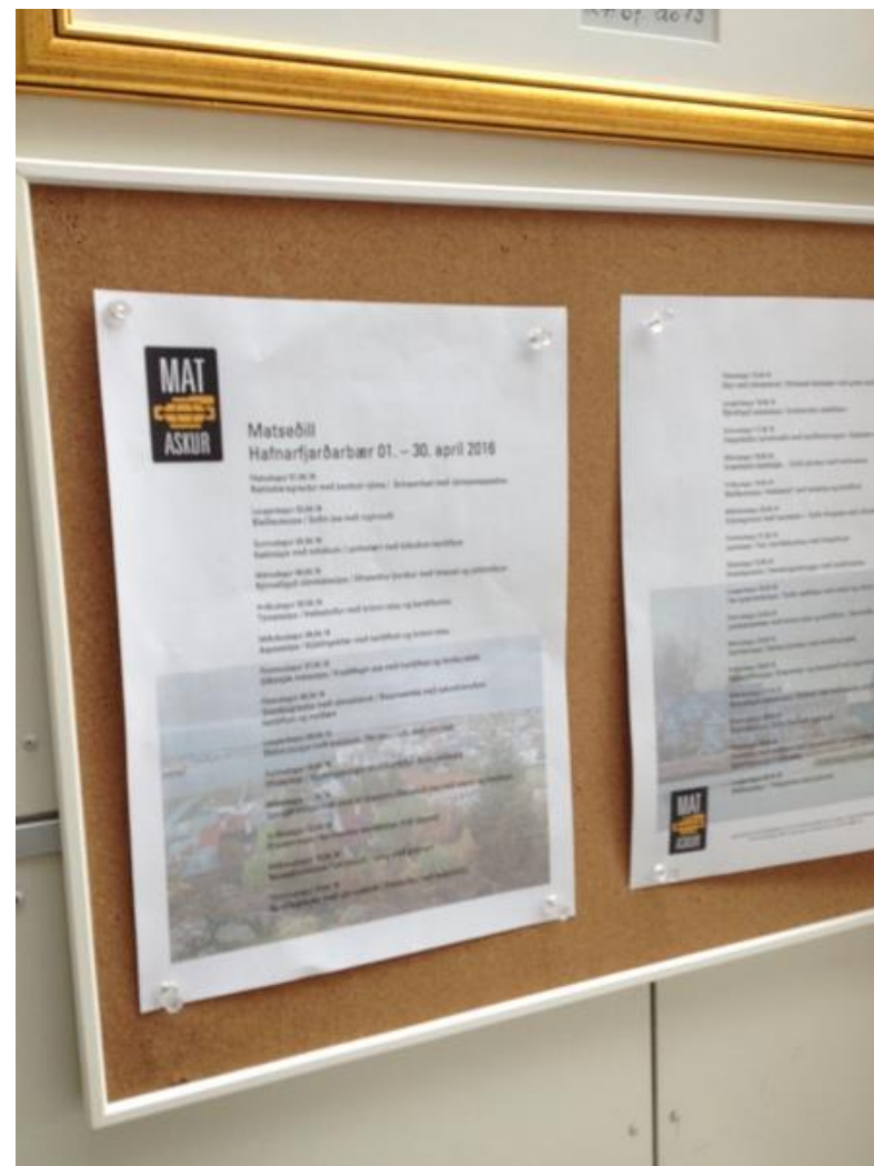
Matseðill dagsins: Sætkartöflusúpa. Grænmetis- og baunabuff með jógurtsósu