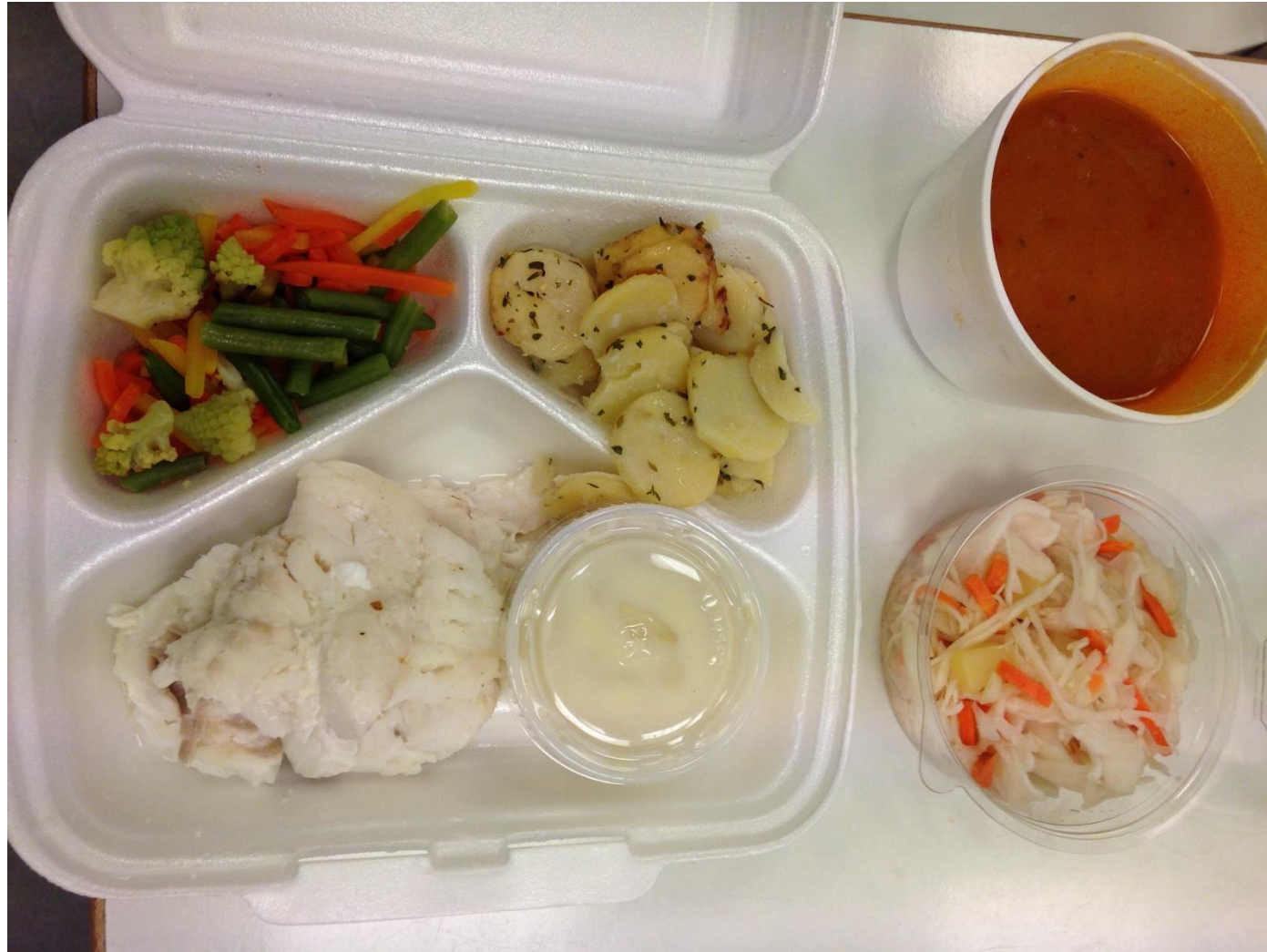
Grænmetis mauksúpa. Soðinn þorskur með hvítvínssósu