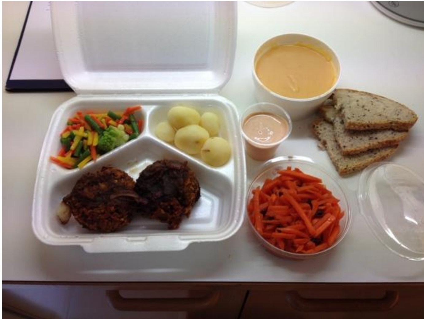
Sætkartöflusúpa. Grænmetis- og baunabuff með jógúrtsósu