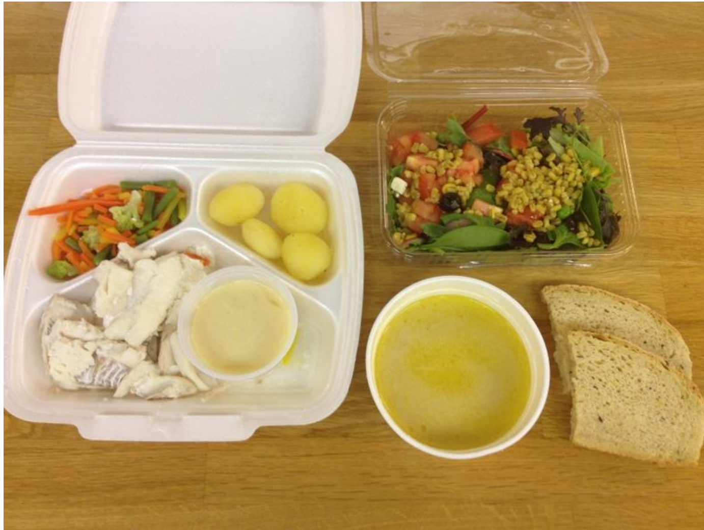
Blómkálssúpa. Soðin ýsa með rúgbrauði