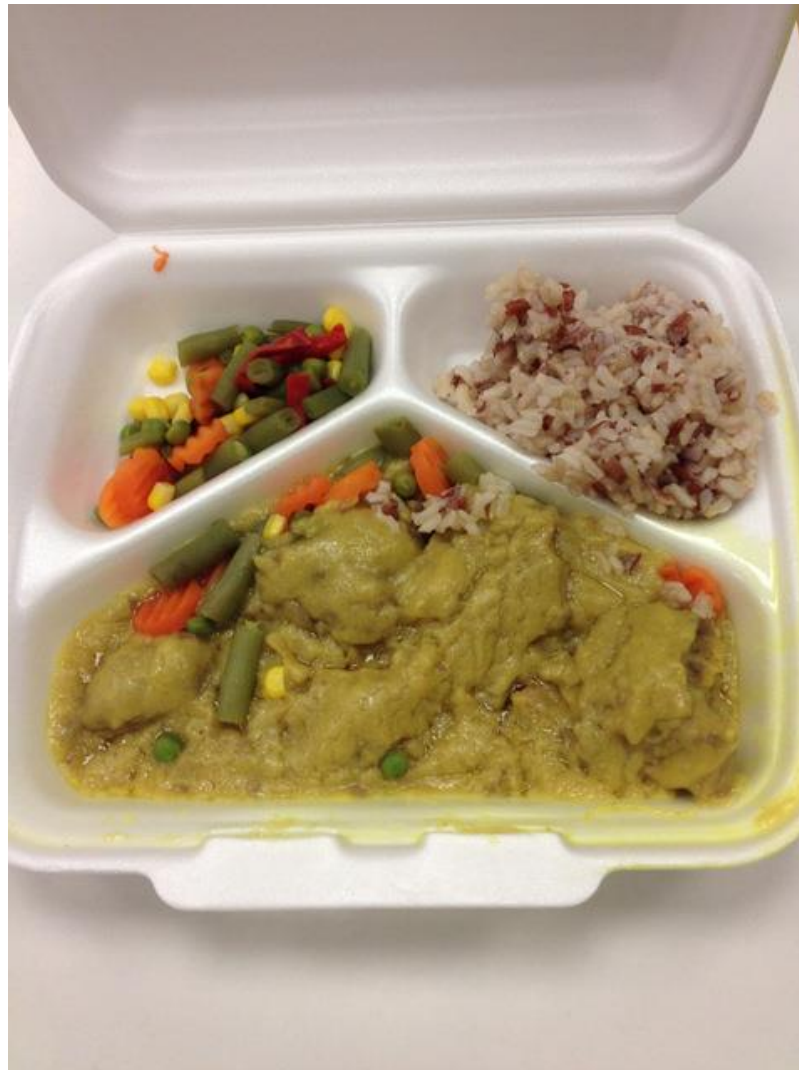
Lambakjöt í karrý með grjónum