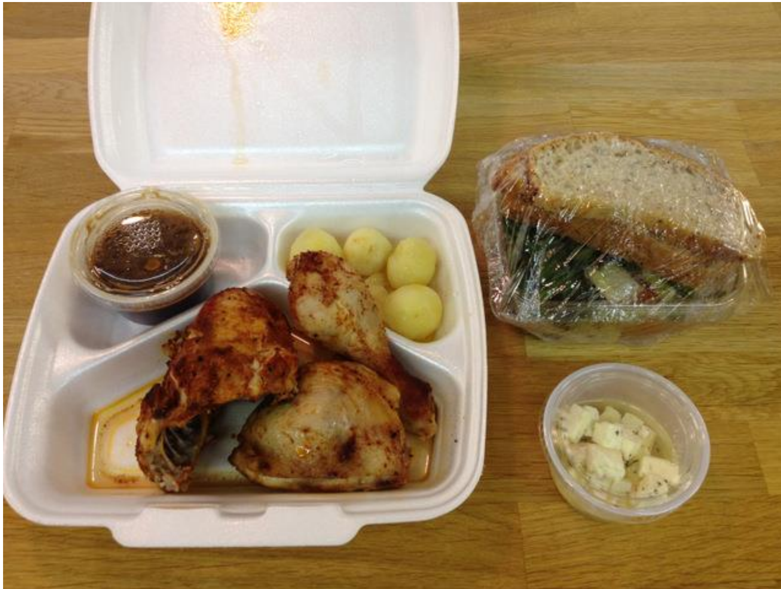
Kjúklingabitar með kartöflum og brúnni sósu