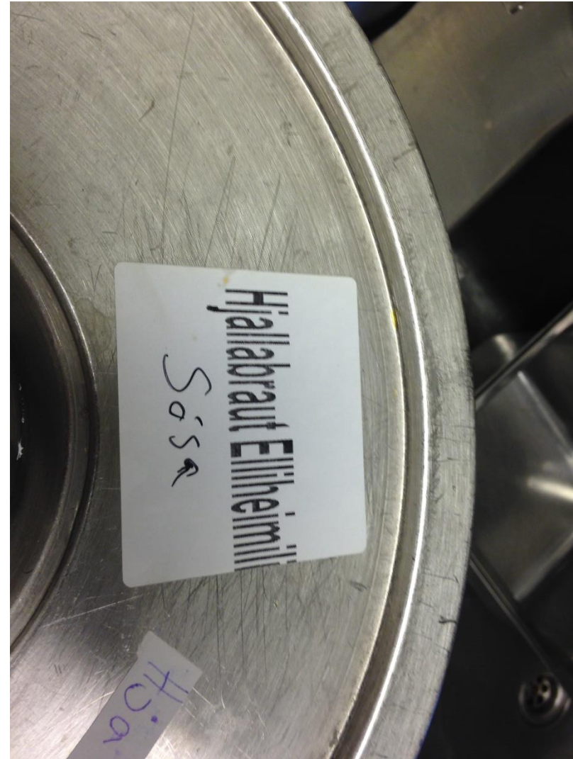
Matseðill dagsins: Grænmetis mauksúpsa. Soðinn þorskur með hvítvínssósu