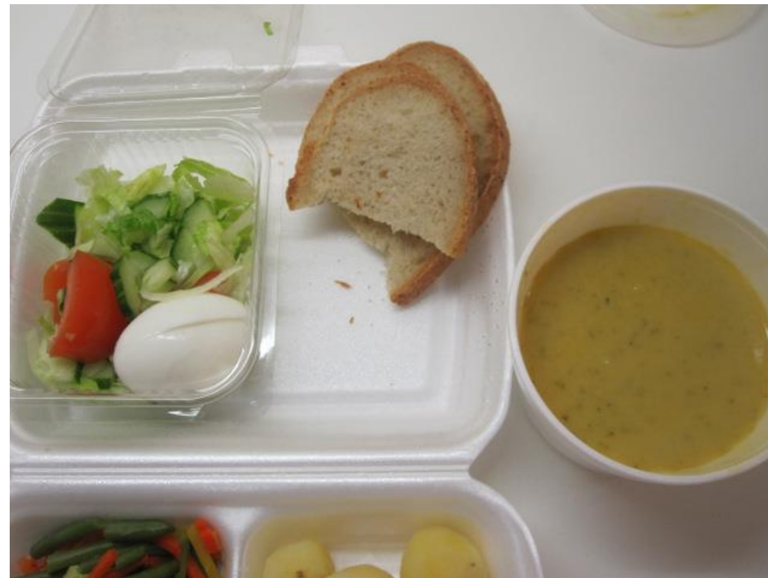
Spergikálssúpa. Ostagljáð ýsa með aspas og tómötum