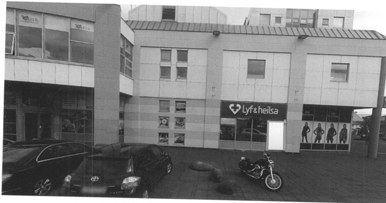
Mynd 1. Séð framan á húsið þar sem ný flóttaleið mun koma úr apótekinu

Þetta minnisblað fjallar um þær breytingar sem verið er að sækja um til byggingarfulltrúa. Ekkert er fjallað um svæði utan breytinganna og engar breytingar gerðar á neinum konseptum í byggingunni. Breytingasvæðið er lítið og afmarkað og tryggt verður að kröfur um brunavarnir m.t.t. öryggis fólks verður að uppfylla í rýmnum. Þetta felur fyrst og fremst í sér bætt fyrirkomulag flóttaleiða og uppfærslu á mikilvægum kerfum í rýmnum (vatnsúðakerfi og brunaviðvörðunarkerfi).