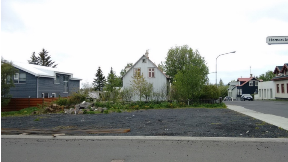
Lóðin Suðurgata 40.