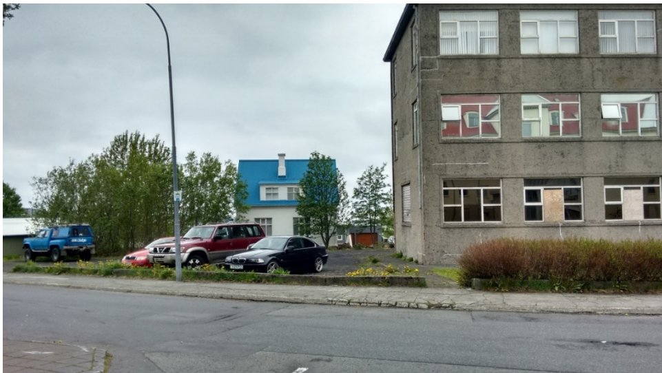
Húsið við Suðurgötu 44 ásamt bílastæðum á lóð.