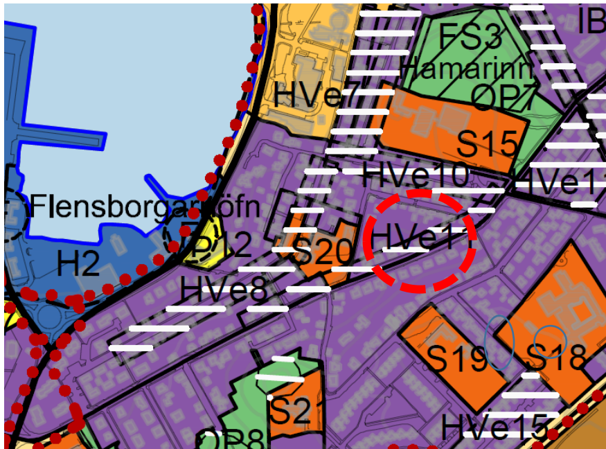
Umrætt svæði merkt með rauðum hring, Aðalskipulag Hafnarfjarðar 2013 - 2025.

Bæjarstjórn Hafnarfjarðar ákvað á fundi sínum dags. 01.02.2017 að fara í óverulegar breytingar á núverandi Aðalskipulagi Hafnarfjarðar í samræmi við 2. mgr. 36. gr. skipulagslaga 123/2010. Breytingarnar ná til lóða við Suðurgötu 40, bílastæðalóð (42) og 44. Breytingarnar eru gerðar til að stuðla að þéttingu byggðar sem er í takt við áherslur Aðalskipulagsins.