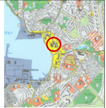
Hlutur gildandi aðalskipulags Hafnarfjarðar. Deiliskipulagssvæði merkt inn með hring.

Deiliskipulag þetta var samþykkt í Skipulags- og byggingarráði Hafnarfjarðar