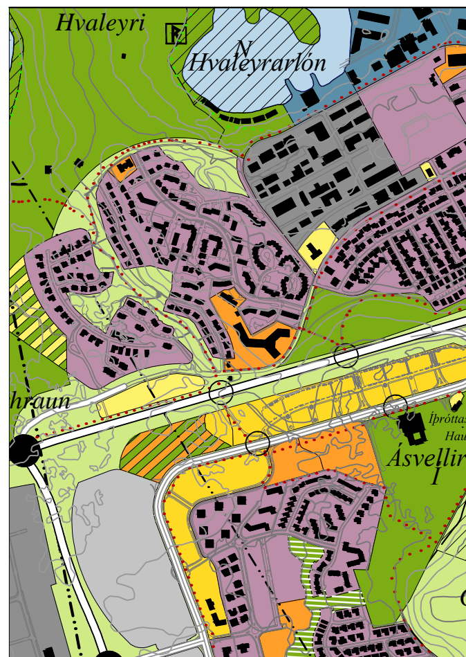
Aðalskipulag Hafnarfjarðar 2005-2025 1:15.000 Staðfest 18.05. 2007, með síðari breytingum