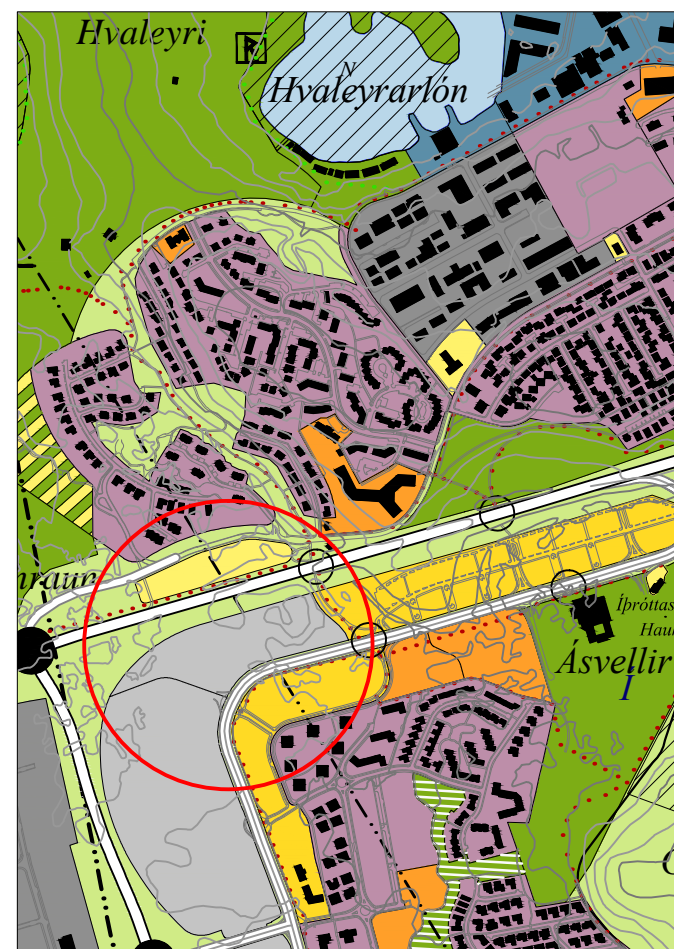
Breytt landnotkun 1:15.000 Mörk breytinga